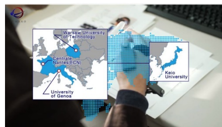
JEMARO 紹介動画(日本語/バージョン)