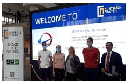
〈ECN(フランス)に到着した海外のJEMARO1期生〉

2020年度より学生の交流も始まり、本格的なプログラムスタートの年であったが、新型コロナウイルス感染症拡大の影響で日本からは渡欧がかなわず、日欧ともにオンラインによる実施となった。そのような状況下でも、プログラム全体の応募者は前年より100名近く増加し、3月にEUパートナー大学との合同選考会が開催され、応募者527名の中から厳正な審査過程を経て18名の受入れ(内日本人2名)が決定している。コロナ禍の交流事業で得た知見を、3月には幅広く採択校以外へも向けたシンポジウムにて発表した。