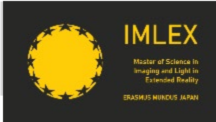
(IMLEXプログラムロゴマーク)

コンソーシアム各大学の強みを生かしEU側は、東フィンランド大学(UEF)がフォトニクス基礎科目、サンティエヌジャンモネ大学(UJM)がイメージング関係科目、ルーベン・カトリック大学(KUルーベン)がライティング関係科目を担当することとし、各大学では、日本語を含む語学関係も学べることにした。日本側は、本学が千葉大学、宇都宮大学と連携し、XR関係の知識・技術を深めながら、文化関係科目も修得できることにした。また、欧州及び日本での企業インターンシップ参加を可能とし、企業関係者の参画も予定している。欧州側大学の参加学生は欧州圏以外の国出身の学生も参加する予定で、欧州側教員・日本側教員の短期相互派遣を毎年度実施することとしていること等、文化的文脈でも多様性のあるプログラムを構築した。