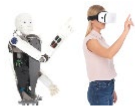
(IMLEXプログラム イメージ)

●QABのミッションは、プログラムの質保証ポリシー策定・実施、モニタリング、質保証促進等を行う。