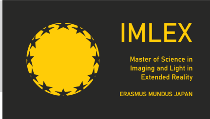
(IMLEXプログラムロゴマーク)

第1期生(2020年入学)については、欧州側学生の渡日ができず、オンラインでの学修を行い、研究指導については、オンラインを活用するとともに、欧州の大学または企業において行っている。日本人学生は、当初予定のとおり、豊橋技術科学大学にて講義の受講及び研究指導を受けている。