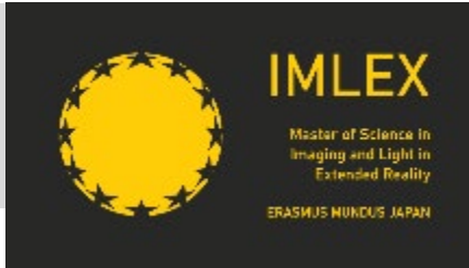
(IMLEXプログラムロゴマーク)

2020年9月より、東フィンランド大学においてプログラムを開始した。日本から8名、欧州側大学から9名の学生が参加し、新型コロナウイルス感染症拡大のため、欧州3大学(東フィンランド大学(UEF)(フィンランド)、サンティエヌ・ジャン・モネ大学(UJM)(フランス)、ルーベン・カトリック大学(KUルーベン)(ベルギー))は、オンラインでのプログラム実施体制を整備し、UEFがフォトニクス基礎科目、UJMがイメージング関係科目、KUルーベンがライティング科目を担当し、オンライン及び対面でプログラムを実施し、IMLEXが目指す人材養成を行っている。