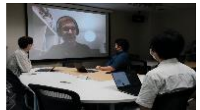
〈IMLEXプログラムにおける オンライン講義の様子〉