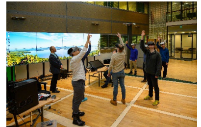
(IMLEXプログラムにおける UEFでの講義の様子)