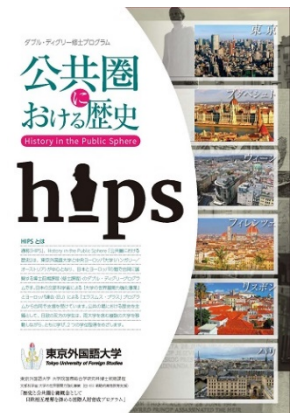
「公共圏における歴史」 パンフレット表紙