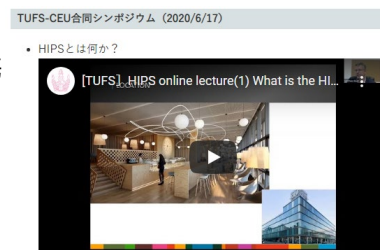
〈TUFUS-CEU合同シンポジウム動画 (事業webサイトより)〉