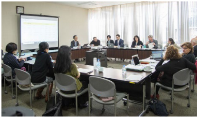
コンソーシアム・ミーティング(2020年2月開催)

・本事業の初年度である2019年度においては、学内の事業推進体制及びコンソーシアム体制の構築を行った。10月～12月にかけて、本学の本事業担当教職員がEU側拠点大学を訪問してコンソーシアム構築に向けた協議を行い、1月には連携4大学によるコンソーシアム協定を締結し、2月には本学でキックオフミーティングを開催した。また、これらの取組の中で、EU・日本双方における教育研修施設およびインターンシップ先相互訪問を行うなど、学生の派遣・受入のための体制構築を進めた。