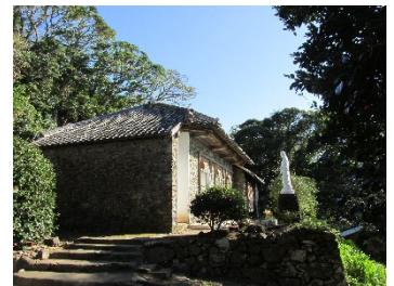
〈国内研修事前視察 (長崎、外海地区)〉