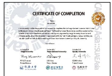
〈 ダブルディグリー修了証書 〉

ダブルディグリープログラムにおいて、2大学から授与されるそれぞれの修士課程の修了証書とは別に、プログラムの修了証書を3大学共通の証書として発行した。ダブルディグリープログラムの修了要件を満たし、3大学のコンソーシアムによって修了を認めた学生へ授与された。