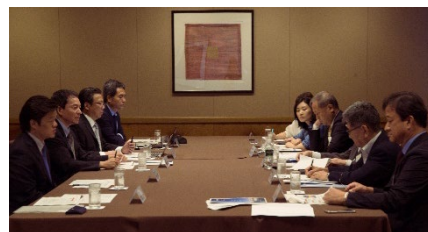
<平成29年度 8月25日 アクレディテーション委員会>

さらに、8月に国内外より4名の委員を招聘し、アクレディテーション委員会を開催し、本事業のこれまでの実績と協働教育プログラムの取り組みに対する外部評価を実施した。そして、①教育プログラム内容、②目標設定、③大学コンソーシアムの運営、④協働教育プログラムの内容および実施、⑤教育評価の方法、⑥情報公開の各項目について外部評価を実施し、いずれの項目に対しても概ねA評価(優れている)の結果を得た。