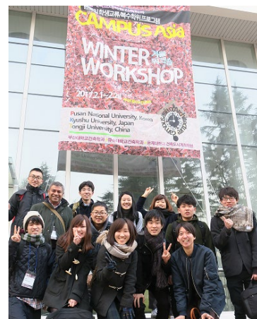
〈釜山ウインターワークショップ〉

【日本人学生派遣】 本事業推進室の専任スタッフによる学生渡航前、帰国後の学業・生活相談体制を整え、留学中に学生の学習面のサポートを行えるよう、教育Webシステムを導入し、運用を開始した。今後の派遣については学生派遣前やサマースクール実施前に、英語力向上セミナーを定期的に開催する準備を進めており、科目履修、課程修了に支障がないようにする。また、外国人学生受入と同様、教育運営委員会を中心に、単位認定可能な科目の設定、授業カリキュラム等のつき合わせを行う。