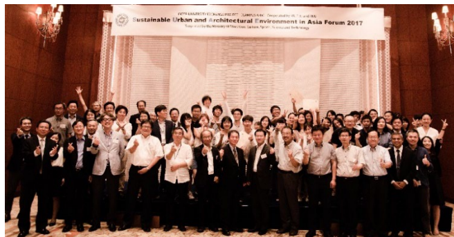
<平成29年度 8月25日SUAE Asia Forum 2017>