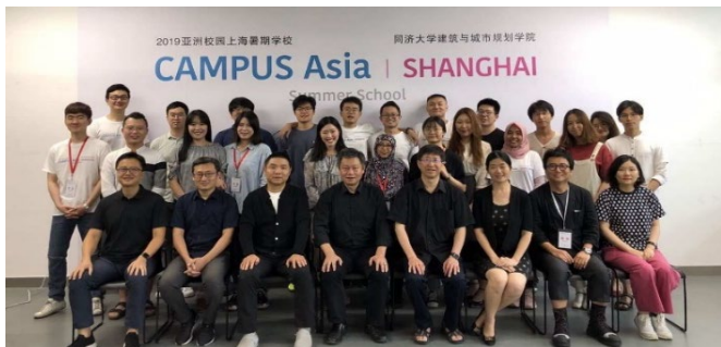
〈 2019 同済サマースクール〉

2018年4月に開始したダブルディグリープログラムでは、計6名の学生を受け入れ、計3名の学生を派遣した。また、3大学で協働実施しているサマースクールが同済大学(上海)にて開催され、3大学の学生が協働で現地の敷地を分析、都市・建築環境問題の解決に向け、提案を行った。