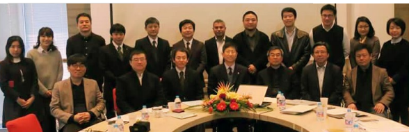
〈同済大学での第二回教育運営委員会 集合写真〉

本プログラムで平成29年度8月に実施されるサマースクールの予行として、学生を中国と韓国に短期派遣した。また、2月には釜山ウインターワークショップを開催し、3カ国の学生が共に学びあう経験を通じ、関係者一同が事業への理解をさらに深めた。