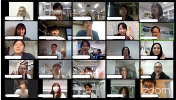
〈 2020 SDCオンラインの様子〉

新型コロナウイルス感染拡大により、実渡航を伴ったプログラムの実施が困難であったため、全てのプログラムがオンラインでの実施となった。2018年4月に始動したダブルディグリープログラムでは、9名の学生が参加し、渡航を希望していたが、やむを得ずオンラインによる授業を受講した。また、3大学で協働実施しているサマースクールについては、3科目開講時期を分割し、オンラインにて開催され、ダブルディグリープログラムへ参加している海外の学生が参加できるように配慮しながら実施した。短期受入についてもオンラインの実施となり、計11名を受け入れた。