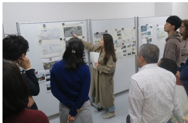
〈 ダブルディグリー学生 授業の様子 〉

3大学協働教育プログラムとして8月にサマースクールを韓国・釜山にて3週間実施した。また、本学にてサステナブル・デザインキャンプを実施する等、国内外の大学の学生と交流する場を多く設けたことで、留学経験のない学生も国際交流の場に身を置くことができ、学生は英語で積極的にコミュニケーションを図りながら、国際性を養うことができている。