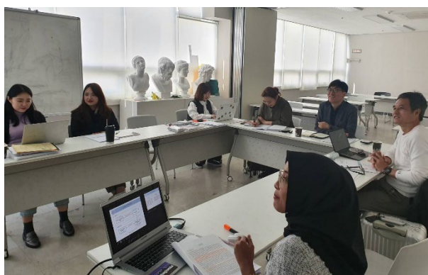
〈 2019 ダブルディグリープログラム 研究室指導の様子 〉

すべての受入学生は研究室へ配属し、受入および指導教員により在籍および出席を管理しており、プログラム前に事前指導・オリエンテーションを英語で行い、履修や課程修了に支障がないように整えている。また、日本人学生留学前には履修手続き等の事前指導を専任スタッフが先行し、留学時にスムーズに修業開始できるようにしている。更に定期的に相談できるようにWebシステムを活用しながら、指導教員によるサポートを行っている。