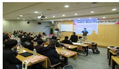
〈ウインタープログラム(ソウル大)〉