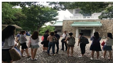
〈3大学サマープログラム(駒場)でのフィールドトリップ〉