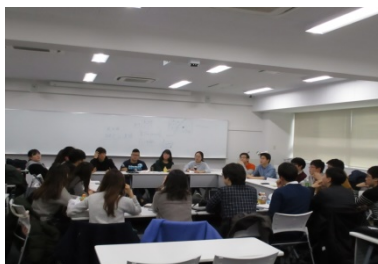
〈ウィンタープログラム(東京大学)でのグループワーク〉