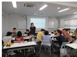
〈3大学サマープログラム(駒場)〉