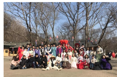
〈ウィンタープログラム(ソウル大)〉