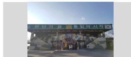
〈ウィンタープログラム(ソウル大学校)でのField Trip〉