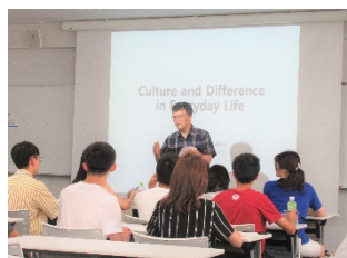
〈3大学サマープログラム(駒場)〉