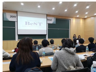
〈ウィンタープログラム(ソウル大)〉