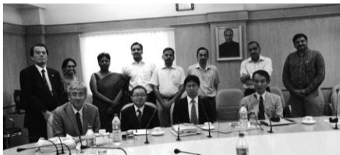
インド鉄道省において本構想の協議