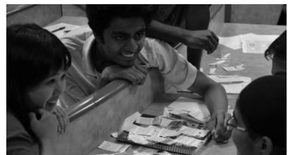
日印学生ワークショップの光景