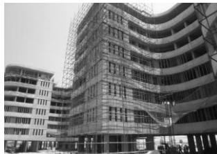
東大がデザインしたIIT-Hの建築