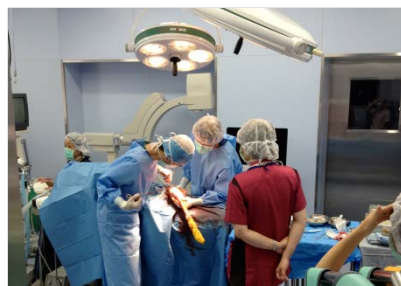
臨床実習(北海道大学)