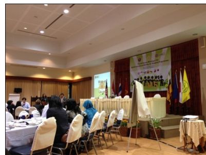
AIMSプログラムレビューミーティング