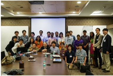
〈バンガロールでの企業視察〉

○日印双方で国際ワークショップやセミナー等を開催し、学生の相互交流を行った。特にインド(バンガロール)で開催したワークショップでは、日本人学生による現地進出企業の視察を併せて実施し、インド進出についての課題等について直接現地企業担当者から話を聞く機会を設けた。