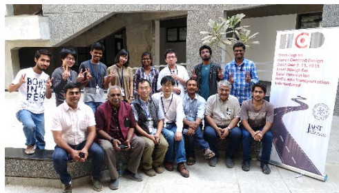
〈インドでのワークショップ〉

○日印双方で開催する国際ワークショップ・セミナーへの参加を目的とした短期の相互学生交流、特別学修生制度による相手校の学部学生の受入を継続するとともに、協働教育研究指導による1～3か月程度の相互学生交流を開始した。