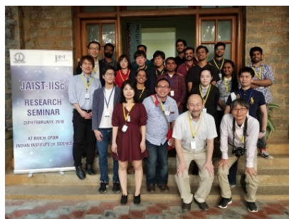
〈インドでのセミナー〉

○日印双方で開催する国際セミナー等への参加を目的とした短期の相互学生交流、特別学修生制度による相手校の学部学生の受入及び協働教育研究指導による2~3か月程度の相互学生交流を継続して実施した。