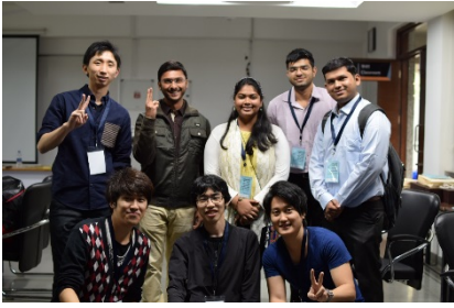
〈インドでのセミナー〉

○日印双方で開催する国際セミナーへの参加を目的とした短期の相互学生交流、特別学修生制度による相手校の学部学生の受入及び協働教育研究指導による2～3か月程度の相互学生交流を実施した。