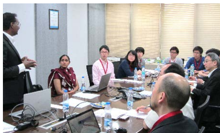
〈バンガロールでの企業視察〉