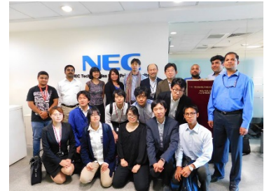
〈バンガロールでの企業視察〉