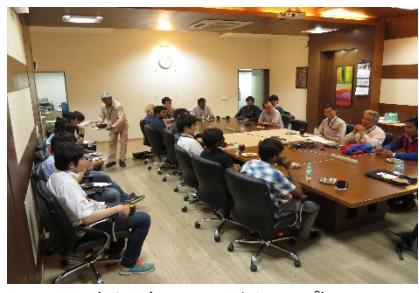
〈インドでのワークショップ〉