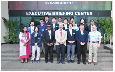
〈バンガロールでの企業視察〉