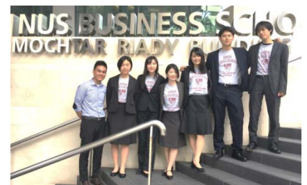
〈シンガポール派遣プログラム〉