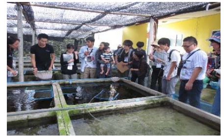
〈カンボジアでのフィールドワーク〉

参加学生は異国の農業を実際に目にすることで、農学に関する専門的知識を身につけた。研修中に訪問国の同年代の学生と英語で討論し、文化の異なる背景をもつ外国人学生との共同作業の経験を積み、国際的な視野が育まれた。グループワークでは、計画立案や成果の取りまとめの討論を通じて協調性を養うとともに、相手の意見をよく聴いて成果をまとめ上げるチーム力・相互理解力を身につけた。