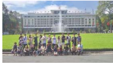
〈ベトナム派遣プログラム〉

平成29年度における本事業の交流プログラムは、全て計画通り実施することができた。具体的には、カンボジア、ベトナム、ラオス、シンガポールへ6つの派遣プログラムを送り出し、カンボジア、ベトナム、ラオス、ミャンマー、シンガポールから学生を受け入れた。各プログラムは、地域の企業や公的機関と連携し、体験型の教育を通して、学識を实践できる能力やそれにとりまうコミュニケーション能力の訓練を行った。