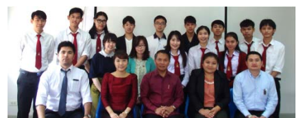
〈ラオス派遣プログラム〉