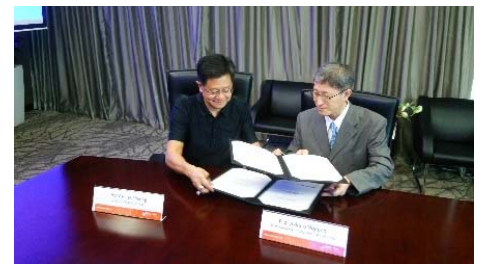
〈交流継続協定調印式 シンガポール国立大学にて〉

平成29年度にはベトナム、カンボジア、ミャンマー、シンガポールから学生の受入を行うことを、平成28年度中の交渉により既に決定している。