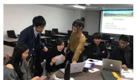
〈JETROの支援による企業とのWS〉