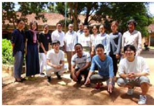
〈カンボジア派遣プログラム〉