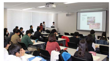
〈中部国際空港にて、H29全体報告会〉