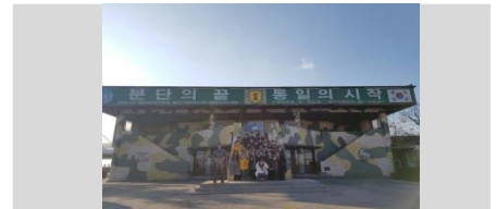
〈ウィンタープログラム(ソウル大学校)でのField Trip〉