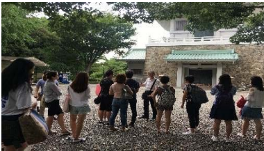
〈3大学サマープログラム(駒場)でのフィールドトリップ〉