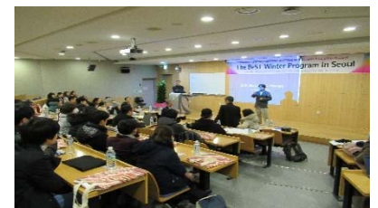
〈ウインタープログラム(ソウル大)〉