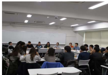
〈ウィンタープログラム(東京大学)でのグループワーク〉