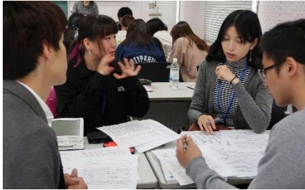
〈CAP共修授業「キャンパスアジア演習」の様子〉