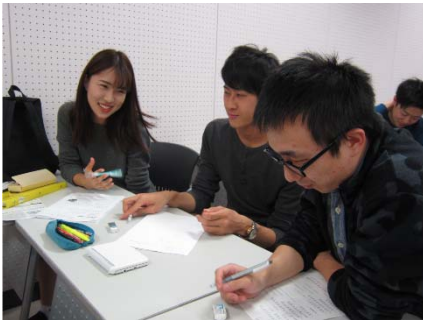
〈CAP生専用語学授業の様子〉