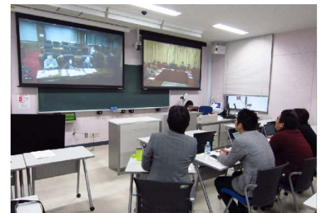
〈第1回キャンパスアジア教授会の様子〉

4月上旬にCAP関連科目の授業を担当する教員15名が集まり会議を行った。初めて授業を担当する先生方にプログラムの特徴についての説明を行ったり、各授業の状況に関する意見交換や、情報交換を行った。