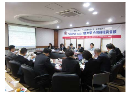
〈韓国・釜山での3大学教職員合同会議〉