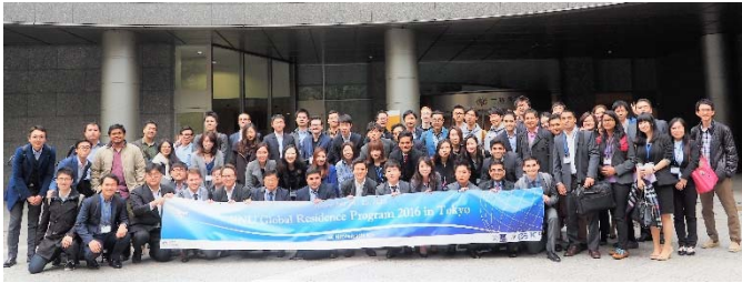
〈11月 ソウル大学Study Tourの合同講義後〉