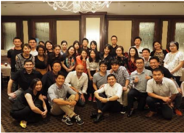
〈Doing Business In Asia〉

一橋大学(以下「ICS」)・北京大学(以下「PKU」)・ソウル大学校(以下「SNU」)の3大学協働による日中韓の次世代ビジネスリーダーを育成するプログラム。MBAプログラムの学生を対象としたダブルディグリー・プログラム、学期間交換留学プログラム、短期集中プログラム及び3大学の教員によるJoint Research を実施する。各活動の成果は、毎年3大学合同で開催するシンポジウムにおいて報告、発表される。本取組は3校による「BEST Business School Alliance」が基盤となっている。平成29年度も計画したプログラム及び運営委員会、Information Session, シンポジウムが予定通り実施された。