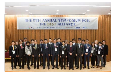
〈11月 ソウルにおけるBEST Symposium〉

本事業の経験・実績を基に、2016年11月には中国人民大学商学院とのダブルディグリー・プログラムに関する覚書を締結した。本事業以外の提携校との交流も発展させることでさらに知見を重ね、より質の高いプログラムやシステムの構築を目指す。