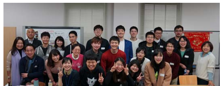
〈 受入学生と派遣学生の交流 〉

○ 本学、清華大学、KAISTにて3大学の担当教職員が集まり、年度内で3回の合同運営委員会を実施した。