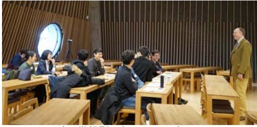
〈21世紀型スキルセミナー〉

平成29年度は、11名を派遣し、20人を受け入れた。計画内容に基づき、順調にプログラムを実施することができた。「研究重視型教育」の強化については、「修学計画書」に基づき、派遣先・派遣元の両教員が学生が取り組む修学計画を理解し、共通認識を持って指導にあたった。