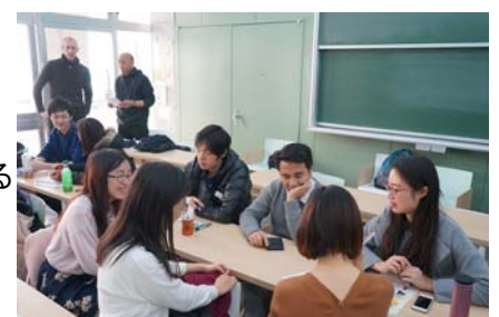
〈 受入学生と派遣学生の交流 〉