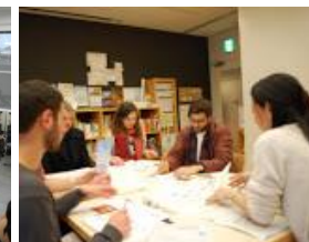
〈「とびらプロジェクト」への参加〉