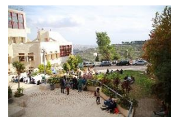
〈ベツアルエル美術デザインアカデミーのキャンパス〉

コーディネーター、プロジェクト専門スタッフ、サポートスタッフを新規雇用・配置 。学生支援に係るネットワークの整備として、教職員がイスラエルに往訪した際に 派遣中の学生と面談し、現地の様子について聞き取り を行った。また、帰国留学生との連絡調整を実施したほか、 在イスラエル日本大使館スタッフとも面会し、交流プログラムの支援について協議 を実施。