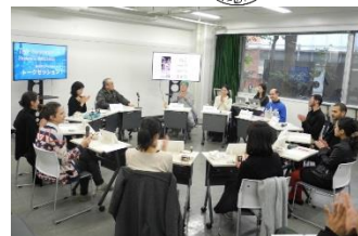
〈両校学生による公開型トークセッション〉

ファインアート分野の学生3名とデザイン分野の学生2名を受け入れ、 両校の学生5人ずつが英語による公開型トークセッションを開催 し、各自の作品・活動、それぞれの大学の相違などを語り合った。また、本学と東京都美術館が共同で実施している、アートを紹介してコミュニティを育む事業「 とびらプロジェクト 」を訪れ、 イスラエルで同様に実施されている芸術に関する社会活動との比較等、活発な意見交換が行われた。