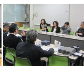
〈ミマール・シナン美術大学の教員を招聘し、学生交流計画の詳細を協議〉