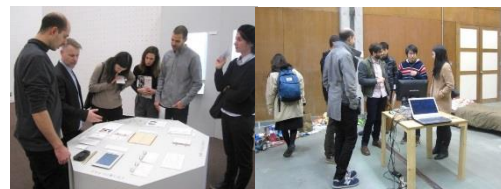
〈本学の卒業・修了作品展で制作者の学生と交流する連携大学の教員・学生〉

大学Webサイトにおいて本事業の概要、計画、将来ビジョンおよび個別の 活動レポートを日本語・英語の双方で公開 。連携大学の教員・学生による本学の卒業・修了制作作品展覧会の鑑賞を実施。