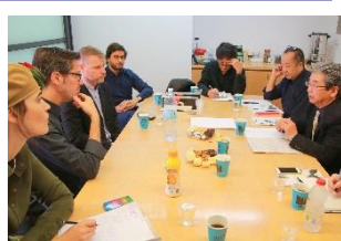
〈ベツアルエル美術デザインアカデミーにおける交流プログラムについての協議〉

本学の教職員が ベツアルエル美術デザインアカデミーに往訪したほか、連携3大学の教員を本学に招聘し、交流プログラムについて詳細な打ち合わせを実施 。産学連携については、陶芸工房や美術館のほか、 香川県 の文化振興課および 県立美術館長とインターンシップ等について協議 を行った。