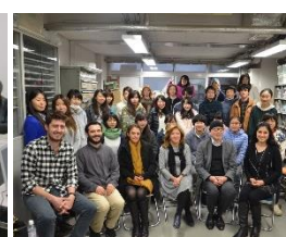
〈アナドル大学の教員・学生と東京藝術大学の陶芸研究室〉