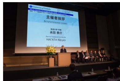
〈 キックオフシンポジウムの様子 〉

カザフ国立大学と本学との間で、大学間共通単位認定枠を盛り込んだ「 キャンパスインキャンパス 」構想の実現に向けた協力を両大学間で進めていく旨を記載した メモランダム を締結した。