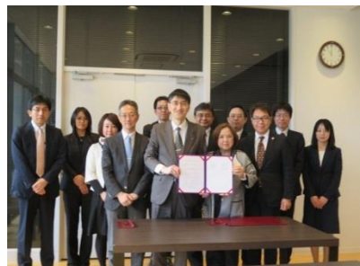
東北大学との協定締結 平成29年3月

平成28年5月、本事業の 中間成果報告会 を実施した。同時に「中間成果報告書」を作成し、内外に成果の発信を行った。