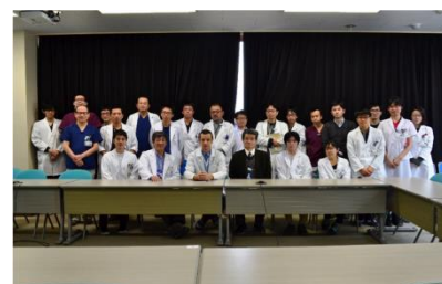
医療実務研修での受入学生と 本学附属病院のスタッフ

2016年5月より、医学群の学生2名が ロシア国立研究医科大学で約1ヶ月の臨床研修を開始 した。この研修は「海外医療実務研修」(11単位)の一環として単位が取得できる。