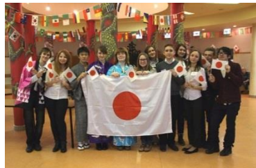
派遣学生とロシア学生の交流 (モスクワにて)