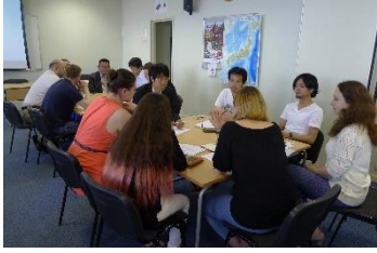
経済フォーラムでのディスカッション (モスクワにて) 平成28年6月

医療実務研修では、本学附属病院にてロシア側の医学生24名を受入れ、約1カ月間の実務研修を実施した。また本学医学群生2名をロシア国立研究医科大学へ派遣し、実務研修を実施した。