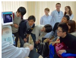
〈 海外研修の様子 〉