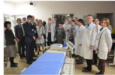
「地域医療に関する日露若手医療関係者交流」 (日露青年交流センター、新潟大学との共催) 平成29年2月

平成28年度、本プログラムの海外研修の一部を人文・文化学群「 海外プロジェクト研修 」(2単位)として科目開設した。医療視察研修についても、医学群医療科学類「 国際生命医科学実習 」(2単位)として単位認定されるようになった。平成27年度にはインターンシップ科目の単位化も始まり、より質の保証を伴った教育活動を実施できるようになった。