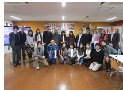
日本語・日本文化研修 平成28年12月

コーカサス諸国( アゼルバイジャン、アルメニア、ジョージア )およびモルドバの有力大学であるADA大学、アゼルバイジャン言語大学(以上アゼルバイジャン)、トビリシ自由大学(ジョージア)、ロシア・アルメニア・スラヴ大学(アルメニア)、モルドバ国立大学と大学間交流協定を締結した。これによりロシア語圏諸国との教育交流の環境が大きく向上した。平成28年12月には、上記 5カ国の日本語教師、日本語学習者を対象とした日本語・日本文化研修 を実施した。