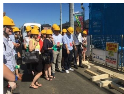
留学生を対象とした 国内インターンシップ 2015年7月

コーカサス諸国(アゼルバイジャン、アルメニア、ジョージア)およびモルドバの有力大学との交流開始を目指し、2015年12月に本学教員が各大学を訪問し協議。このうちアゼルバイジャン言語大学、トビリシ自由大学(ジョージア)、ロシア・アルメニア・スラヴ大学(アルメニア)と大学間交流協定を締結。モルドバの大学とも平成28年度に協定を締結し、交流を開始する予定である。