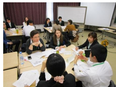
日露学生フォーラム2015で 討論する日本人・ロシア人学生 2015年12月

平成27年度に「海外インターンシップ」科目、「国内インターンシップ」科目(いずれも2単位)を新規開設し、平成28年度中には「海外プロジェクト研修」の新規開設も決まった。これにより、派遣学生、受入学生に対して、より質の保証を伴った教育活動ができるようになった。