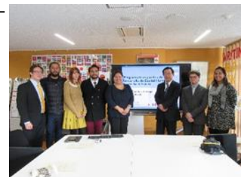
〈研修プログラム終了式(平成28年3月)〉

平成28年3月9日および10日、第一回共同プログラム運営委員会をブラジル、サンパウロ大学に於いて実施し、提携5大学との間で、枠組形成に向けた協力体制の整備を完了した。今後継続して、具体的な教育プログラムの内容として、受入派遣に関する学年暦に基づく調整や科目群整備、大学間単位認定共通枠の構築等に関する実務者協議を行っていく。