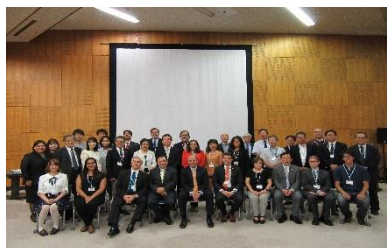
〈共同プログラム運営委員会での提携5大学との集合写真(平成28年9月)〉

学内プログラム実施委員会を中心に、海外連携大学との調整、科目の新設、共同プログラム運営委員会の開催等、プログラムの円滑な実施に向けた学内外との精力的な調整と協力体制の強化を進めてきた。今後も、受入派遣に関する課題(学年暦調整、科目群整備等)について継続して協議を行う。