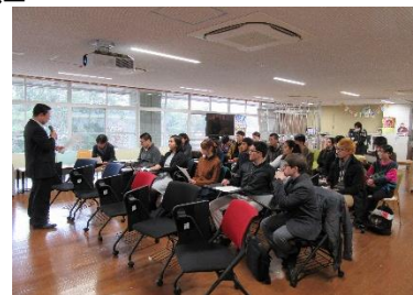
〈プログラム報告会(平成29年3月)〉

平成28年9月、連携大学の国際部長級から成る共同プログラム運営委員会を、本学(つくば市)にて開催し、事業のフォローアップ及び課題の抽出と解決に向けた協議を行い、派遣・受入期間の具体的な日程の調整をはじめ、共通カリキュラムの実現に向けた教育プログラムの検討、指導教員及び指導体制の協議等を行った。