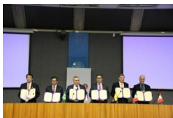
〈共同プログラム運営委員会における提携5大学との覚書締結(平成28年3月)〉

平成28年3月、提携5大学との交流プログラムの円滑な実施に向け、既存の大学間交流協定を補完する覚書を締結、協力体制の整備を完了した。今後も具体的な教育プログラムの内容として、受入派遣に関する課題(学年暦調整、科目群整備等)について継続して協議を進めている。