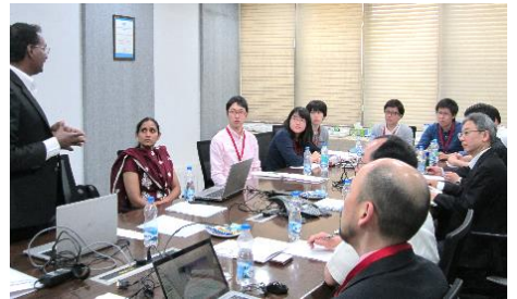
〈バンガロールでの企業視察〉