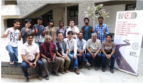
〈インドでのワークショップ〉

○日印双方で開催する国際ワークショップ・セミナーへの参加を目的とした短期の相互学生交流、特別学修生制度による相手校の学部学生の受入を継続するとともに、協働教育研究指導による1～3か月程度の相互学生交流を開始した。