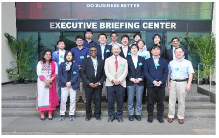
〈バンガロールでの企業視察〉