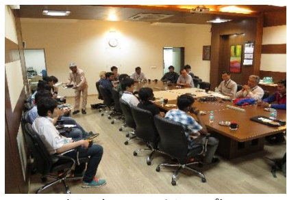
〈インドでのワークショップ〉