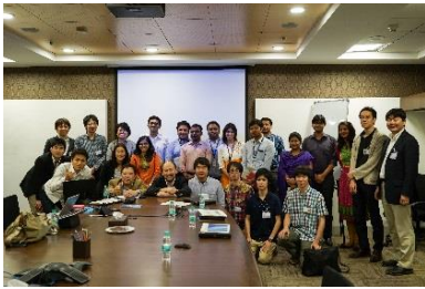
〈バンガロールでの企業視察〉

○日印双方で国際ワークショップやセミナー等を開催し、学生の相互交流を行った。特にインド(バンガロール)で開催したワークショップでは、日本人学生による現地進出企業の視察を併せて実施し、インド進出についての課題等について直接現地企業担当者から話を聞く機会を設けた。