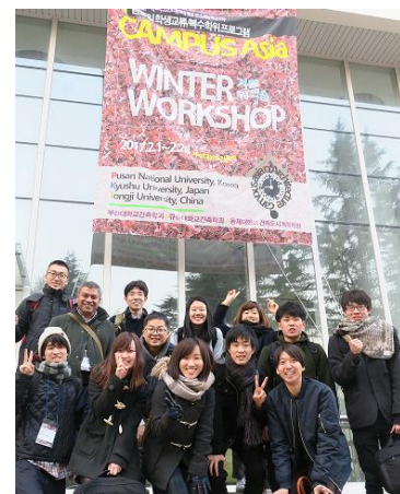
〈釜山ウインターワークショップ〉

【日本人学生派遣】 本事業推進室の専任スタッフによる学生渡航前、帰国後の学業・生活相談体制を整え、留学中に学生の学習面のサポートを行えるよう、教育Webシステムを導入し、運用を開始した。今後の派遣については学生派遣前やサマースクール実施前に、英語力向上セミナーを定期的に開催する準備を進めており、科目履修、課程修了に支障がないようにする。また、外国人学生受入と同様、教育運営委員会を中心に、単位認定可能な科目の設定、授業カリキュラム等のつき合わせを行う。