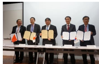
〈大学間協定・覚書の締結〉

国際教員会議にて、学生のサポートに加え、単位の相互認定、成績管理、学位授与に至るプロセスを各国、各大学の状況に沿って、合意形成に向けて共通の基準を議論した。国際教員会議・国際シンポジウム・各研究教室でのセミナーを通じて、教員の交流を行った。ダブル・ディグリーに関しては、博士課程の履修期間の中で相手先の大学に留学し、授業・実習、研究、学位論文の指導を二国間の大学教員が行い、大学間で合意した基準を満たした場合に学位を授与する方針を固めた。