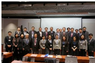
〈国際シンポジウム〉