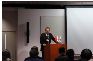
〈プロジェクトリーダーの挨拶〉