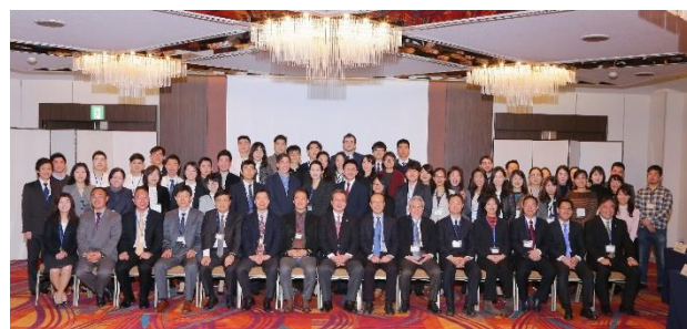
日中韓3大学共同国際シンポジウム(日本・神戸)