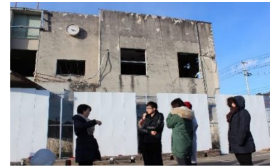
東北フィールドトリップ(大槌町)