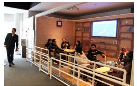
地震体験 野島断層フィールドトリップ(淡路島)