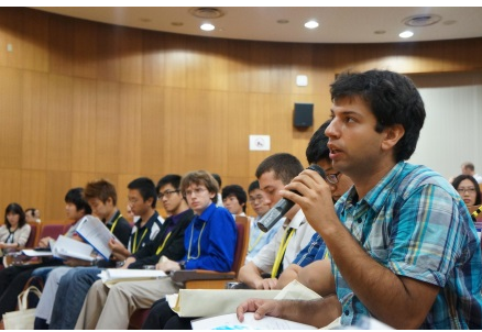
サマープログラムにて議論している様子