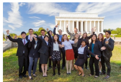
(インターンシップ専門機関ワシントンセンター)

<平成35年の最終目標値19.6%⇒現状1.5%> 英語による授業科目を、平成28年度のカリキュラム改編に際し急速に拡大していく計画である。特に、29年度新設予定の学部には、英語のみで卒業できるコースを開設する。また、新任教員の採用条件に英語運用能力を課す等し、本割合を加速させる。