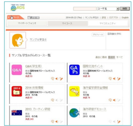
〈Eポートフォリオによる成果の可視化〉

TOYO-UCLA継続教育センター等において、全世代を対象とする共同講座を展開し、平成35年に講座開講数を500、受講者数10,000人を目指す。