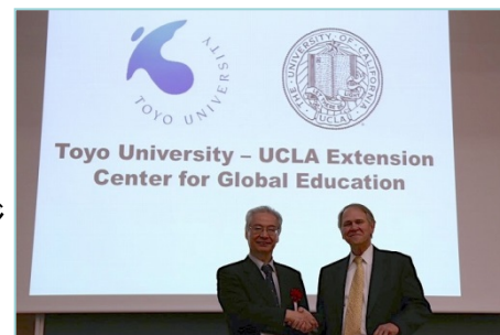
〈UCLAエクステンションとの提携〉

新学部設置や高大連携等、本学が推進する総合学園計画と連動した「全世代グローバル教育」を推進する。平成27年2月13日にUCLAエクステンションと東洋大学の間で正式協定を結び、「TOYO-UCLA継続教育センター(Toyo University - UCLA Extension Center for Global Education)」を正式に発足させた。本センターでは、BEC(Business English Communication)プログラムを提供する。また、本学学生が正規科目として受講できるコースとして、平成27年度から学部生向けの「ビジネス英語」を設置した。この授業は、UCLAエクステンションのBECと同じカリキュラムで行われ、学生が引き続きセンターでの課外クラスを受講することにより、UCLAエクステンションから認定を受けることができる。また、今後も幼稚園や小・中・高の生徒、シニアを対象にした英語プログラム、留学支援プログラム、夏期海外研修等を企画・運営し、全世代グローバル教育を実践する。