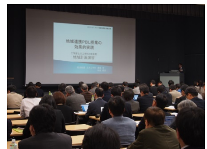
〈 FD活動の様子 〉

専門科目および教養科目の英語化を推進するために、米国モンクレア州立大学の講師を招へいし、同大学が実施するTeaching in Englishプログラムの短期集中版を平成27年3月22日~24日の3日間の日程で開催。SGU事業採択校として、国内の高等教育の質の向上を図るべく、他大学からの参加者も募った。学内から42名、学外から26名が参加した。