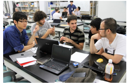
〈 イタリア協定校とのグローバルPBL 〉

海外インターンシップを積極的に推進し、23社に31名を送り出した。JD(ジョイント・ディグリー)・DD(ダブル・ディグリー)を相互に実施する協定校の数は1校であるが、正式に協定締結まで至っていないものの、基本的に合意しており今後話を詰めていく候補校は5校となっている。