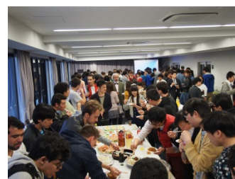
〈国際学生寮入寮パーティー〉

学内で無料で受験できるTOEIC IPテストを年6回(正課の授業内での前期・後期各1回を含む)実施し、また同時にCEFR(The Common European Framework of Reference for Languages: Learning, Teaching, Assessment)を実施し、学生の語学レベルの把握に努めた。また、正課の授業に加え、無償で受講できるラーニング講座やTOEICの特別対策講座を実施した。