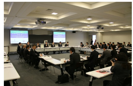
〈 GTIコンソーシアム準備委員会 〉

本学ではJABEEの導入、PDCAサイクルによる教育プログラムの改善により、教育の質保証を進めてきた。しかしながら、講義で代表される受動的学修(Passive Learning)だけでは学生の能力向上が達成しがたい。そこで、学生達が自ら教育プロセスに参加する能動的学修(Active Learning)を導入した。平成26年度は、その典型的な手法であるPBLを海外の協定校と国内外で17プログラム実施し、約200名の学生が参加した。教育の質保証においては、PDCAサイクルを教職学協働で回すことにより、継続的・長期的に適宜改善していく体制を構築した。Checkプロセスでは、学生の達成度を測る通常の試験に加えて、ルーブリックやPROGによる客観的評価の導入を進めた。