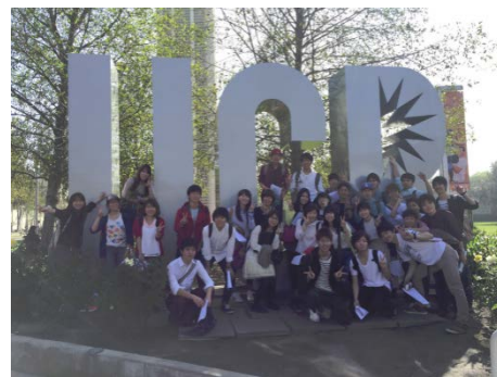
〈スタディアブロードプログラム〉

日本人学生に対するグローバル教育の柱の一つとして、全学のスタディアブロードプログラム(SAP)などの短期海外派遣プログラムや部局の特徴を生かした短期派遣プログラムの開発と実施に注力。H26年度は400名を超える学部学生が参加。さらに前年度初めて実施して好評だった「入学前海外派遣プログラム ~High School Bridging Program~」をH27年3月に実施した。