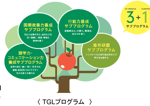
〈 TGLプログラム 〉

高い専門基礎力の前提のもと、「語学・コミュニケーション力」、「国際教養力」、「行動力」を養う授業や講座・セミナー等からなるサブプログラムと「海外研鑽」サブプログラムを有機的に組み合わせた学部学生向けのグローバルリーダー育成プログラムを実施。国際共修ゼミや課題解決型授業、グローバルキャリアセミナー等多くの授業を開講した。TGLプログラムには学部1、2年生を中心に約2,000名の学生が登録。所定の条件を満たした学生を「グローバルリーダー」として認定。