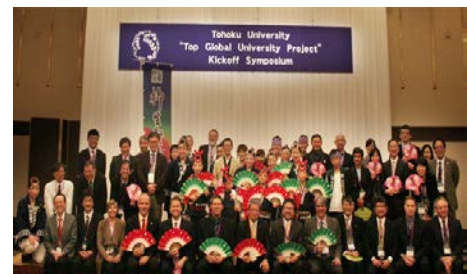
〈 SGUキックオフシンポジウム 〉

本学のスーパーグローバル大学創成支援事業のキックオフシンポジウムをH27年2月に開催。マインツ大学、リヨン大学、ケンブリッジ大学、ケースウエスタンリザーブ大学、ワシントン大学、チュラロンコン大学等からゲストを招聘し、本構想を紹介するとともに、海外パートナー校との国際共同による新たな教育・研究について議論を深めた。国内外から約100名が参加。