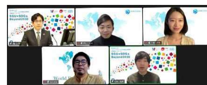
〈One Young Worldセッションの様子〉

本事業がスタートして7年が経過し、PRIMEプログラムで育成している高度実践人と書いたような学生達の成長やその活躍を伝えられるシンポジウムとなった。