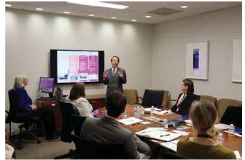
〈米国国務省・教育文化局(ECA)訪問〉

本学は、米国国務省の教育文化局(ECA)が運営する「米国国務省クリティカル・ランゲージ・スカラシップ(CLS)日本プログラム」に採択された。本プログラムは、全米の大学から集う約500人の応募者の中から学業・人物ともに優秀な大学学部生や大学院生を26人選抜し、日本の大学で日本語と日本文化を学ぶことができる2カ月間の短期留学プログラムである。2019年6月から受け入れを開始し、本学では地域を活かした課外活動やホームステイ活動等を提供して、全学レベルで進めているSDGsやESD(持続可能な開発のための教育)を通じた人材育成拠点として、グローバル教育を一層推進していく。