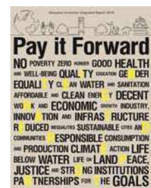
〈岡山大学統合報告書2019-Pay it Forward-(英語版)〉

発行にあたり、「岡山大学統合報告フォーラム2019」を開催し、本学同窓生・学生、高校生、他大学及び企業関係者、地域の方々から約200人が来場した。