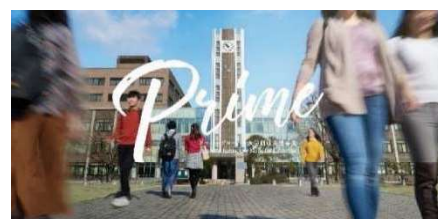
〈「スーパーグローバル大学創成支援事業」ウェブサイトTopページ〉