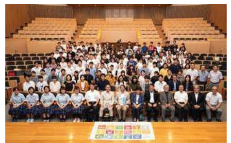
〈キックオフミーティングの開催〉

また、SDGsの普及・推進活動に賛同する個人または団体を「岡山大学SDGsアンバサダー」として任命する制度を新たに設け、133人を任命した。こうしたSDGsアンバサダーの取組が活性化することで、本学のSDGsの普及・推進が加速することが期待される。