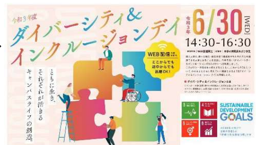
〈ダイバーシティ・インクルージョンデーの開催〉

令和3年6月には、キックオフとして「ダイバーシティ・インクルージョンデー」を開催し、様々な属性や個性を持った教職員及び学生が、D&I 推進への思いや期待についてパネルディスカッションを行った。