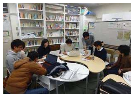
〈ヘルプスタッフによるサポート〉

オリエンテーションは、言語別(日・英)に行い、岡山大学生協、携帯電話の説明など生活に必要な情報案内を増やすとともに、寮のレジデント・アシスタント(RA)や学生ヘルプスタッフなどを通して到着直後の留学生の支援がスムーズにできるよう内容を充実させた。