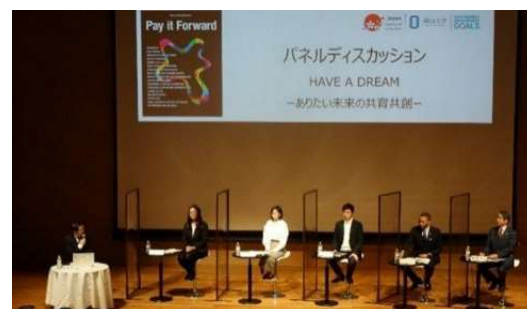
〈パネルディスカッションの様子〉

発行にあたり、「HAVE A DREAM - ありがたい未来の共育共創 - 」と題した統合報告フォーラムを対面とオンラインのハイブリッド型で開催した。当日は、本学教職員・学生、同窓生、高校生、他大学関係者、企業・地域の方々らが、会場とオンラインを合わせて約180人参加した。本学のステークホルダーでもあり、今後の将来を担う若者をパネリストに招き、「HAVE A DREAM - ありがたい未来の共育共創 - 」をテーマにパネルディスカッションを実施した。