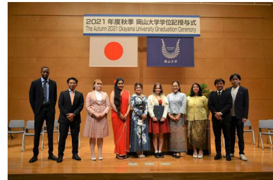
〈学位授与式の様子〉

引き続き、学部や学科の枠にとらわれない履修プログラムにより、グローバルに活躍できる人材育成を推進していく。