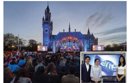
〈オランダ・ハーグでの開会式〉

オランダ・ハーグ市で開催された「One Young World (OYW)2018」に本学の学生2人が日本代表団の一員として参加した。OYWは、世界190カ国以上から各国を代表する次世代の若いリーダーが会する世界最大級のサミットである。本学は、2015年から4大会連続で公式パートナーとして参加している。SDGsを枠組みとしながら、気候変動から戦争と平和、教育、人権、リーダーシップ、グローバルビジネス等、多岐に渡ってディスカッションを行った。