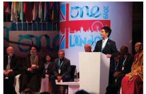
〈全体セッション登壇の様子〉

イギリス・ロンドン市で開催された「One Young World 2019」に本学の学生2人が日本代表団の一員として参加した。うち1人が、全体セッションの一つ「One Young World 宗教間対話(One Young World Interfaith Dialogue)」において世界ユース代表の1人として選出され、現職のリーダーらと共に登壇した。日本人として史上3人目となるステージ選出であり、本学として初の快挙。