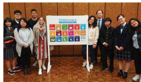
〈津山アイディアソンの報告会〉

令和2年3月現在で、142人(日本を含め25カ国)の学生がグローバル・ディスカバリー・プログラムに在籍し、総勢14人(日本を含め5カ国)の専任教員で構成する多様性に富んだ組織で運営している。授業の一環として地域社会のSDGsを考える「津山アイディアソン」に海外生を含む学生27人が参加した。津山市役所、観光協会、商工会議所関係者、NPO、地域の方々、高校生や教員等と一緒に報告会にも参加し、津山の歴史や文化を活かした体験型博物館やカフェ、環境保護活動、地域の起業家支援等について報告した。