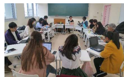
〈グループディスカッションの様子〉

令和3年3月現在で、198名（日本を含め28カ国）の学生がグローバル・ディスカバリー・プログラムに在籍し、総勢14名（日本を含め5カ国）の専任教員で構成する多様性に富んだ組織で運営している。新型コロナウイルス感染症の影響により、オンライン授業を基本としつつ、渡航制限等の事情により入国や登校ができない学生に配慮しながら一部の科目について対面とオンラインを混ぜたハイブリット形式での授業を実施した。実践的な学びについては、新規の海外留学や研修などに学生派遣できなかったが、従来通り実験・実習科目やフィールドワーク、課題実践を開講したほか、新たに動画制作等を学ぶための特別科目を開講した。