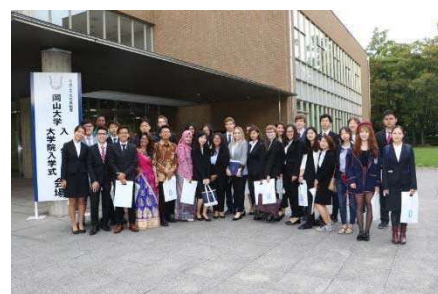
〈入学式会場前の グローバル・ディスカバリー・プログラム第1期生〉

入試関係では、第1期生の入試結果等により入試制度を見直し、3期実施していた国際入試を2期に集約した。平成30年度入学の国際入試においては、24カ国から募集人員の2.7倍を超える82人の志願者があり、国際バカロレア入試では若干人の募集に対し、7人の志願者があった。