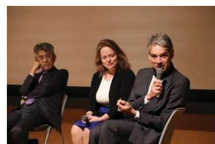
〈グローバル・ディスカバリー・プログラム開設記念シンポジウムのパネルディスカッション〉

平成29年2月に、国内外から講演者を迎え、グローバル・ディスカバリー・プログラム開設記念シンポジウムを開催した。このシンポジウムを通じ、グローバル・ディスカバリー・プログラムの更なる周知及び大規模総合大学において同様の取り組みを進めてきた米国、オランダ、日本の先進的事例を紹介し、グローバル実践人の育成に向けてのビジョンと課題について参加者間での共有を図った。