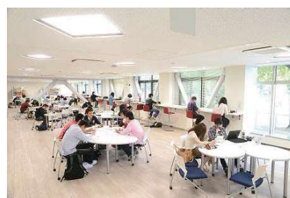
〈ラーニングコモンズ〉

中央図書館、鹿田分館の耐震改修工事により、両館にラーニングコモンズ、セミナー室・グループ学修室等の自主学修スペースを確保した。新しい施設の効果や、クリティカルシンキングやフィンランド方式対話法によるコミュニケーション能力を育成する教育プログラム開発に向けたパイロット授業等の多様なイベントを実施したことなどにより、中央図書館の平成26年度入館者数は451,894人となり、対前年度比約1.5倍に増加した。