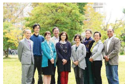
〈グローバル・ディスカバリー・プログラムの教員陣〉

入試関係では、平成28年度から実施した平成29年10月入学者の国際入試に向けて専任教員を中心に11カ国・75校の高校等を訪問した。第1期(11月～12月実施)及び第2期(2月実施)の国際入試では、15カ国から募集人員の2倍を超える53人の志願者を得た。2月に実施した国際バカロレア入試では若干人の募集に対し、4人の志願者があった。