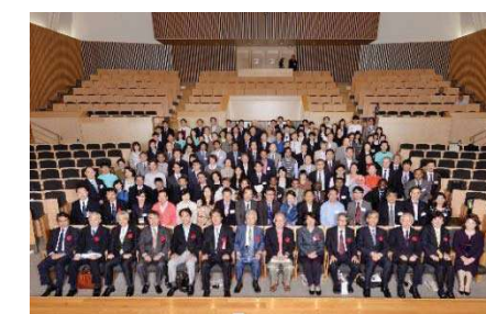
〈スーパーグローバルデーの開催〉

グローバル化・国際交流の推進を目的とした新たな試みとして「岡山大学スーパーグローバルデー2015」を開催し、国際同窓会の海外支部同窓生など国内外から集まった400人を超える来場者が交流を深めました。