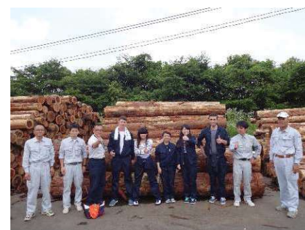
〈UBC学生とのCo-opプログラム実施〉

実践型社会連携教育科目については、試行を教養教育13科目で行い、平成28年度から教養教育約60科目及び専門教育約50科目に本格導入する。