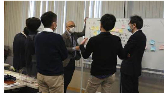
〈グループディスカッションの様子〉