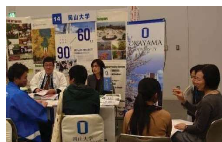
〈グローバル・ディスカバリー・プログラム広報 (第3回GO Global Japan Expo)〉

留学フェア参加や海外高校訪問を行い、広報・リクルート活動を行った。また、海外における人材需要の把握、必要とされる専門性や能力の整理を続けた。さらに学生・社会のニーズに合った教育効果の高い実践力を兼ね備えた人材を育成するカリキュラム開発及び同プログラムが求める人材に合う志願者を獲得するための入試制度を整備した。