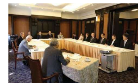
〈外部評価委員会の開催〉