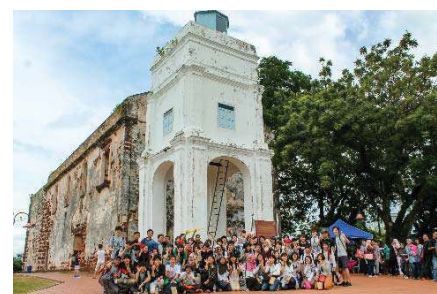
〈マレーシアにおける事務職員の海外研修〉

また、事務職員の海外研修として、マレーシア(マラヤ大学・語学研修プログラム参加)や中国へ派遣した。