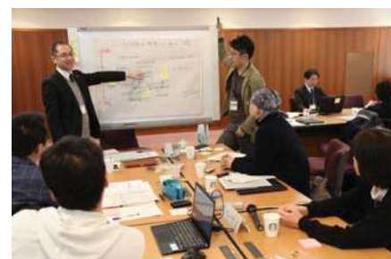
〈岡山大学未来懇談会Session1-1〉

「岡山大学の未来像～大学院の強化を中心に～」をメインテーマとし、各部局から若手教職員31名が参加して4グループに分かれ、議論では現実的な課題解決案から岡山大学の未来を拓くアイデア等を発表した。