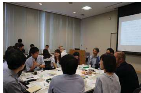
〈関連な議論が行われたグループ討議〉

本学では、次世代を担う若手教職員が自由な発想で持続可能な岡山大学を考える新たな大学ガバナンスプラットフォームとして「岡山大学未来懇談会（未来懇）」を平成29年度より開催している。令和元年度は「岡山大学×国連SDGsのさらなる深化に向けて」をテーマに、現役の若手教職員に加え岡山大学SDGsアンバサダーの本学学生も参加した。その成果として、キャンパス環境・教育・研究の目に見える改善を実行するための計画案を提案し、岡山大学が「学びたい大学」、「働きたい職場」となる「もっと選びたくなる岡山大学へ進化」のための道筋を示した。これらの提案を、今後のSDGs大学経営に反映していく。