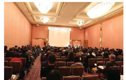
〈 産学官連携のためのシンポジウム 〉

また、実践型社会連携教育プログラムの定義(案)を定め、平成27年度に行う試行科目を決定し、平成28年度実施予定の授業科目案を作成した。今後は、プログラムの自己点検結果を踏まえ全授業科目を点検し、平成28年度に本格導入する。