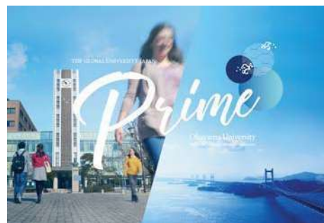
〈スーパーグローバル大学創成支援事業パンフレット(英語版)〉