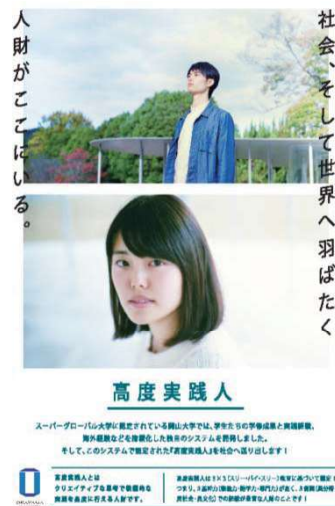
〈高度実践人パンフレット〉

平成28年度から全学60分授業、4学期(クォーター)制を導入した。また、全学教育体制を見直し、「全学教育・学生支援機構」を新設するとともに、一体化した教育改革の推進を目指し、平成29年度に向けた全学60分授業・4学期制の検証・改善と教養教育科目(リベラル・アーツ)の充実を図った。さらに、実践人を育成するPRIMEプログラムの高度実践人認定システムを構築した。