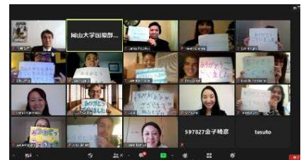
〈オンライン開催の様子〉

令和2年度は、10月から7週間、オンラインで開講し、全米から選抜された13人の留学生が受講した。日本語のオンライン授業のほか、学内環境理工学部ビオトープのバーチャル体験や、矢掛町の街並み紹介と矢掛高校との学生交流、茶道師範による茶道体験などの学外文化活動をライブセッションで行うなど、「リモート×地域との協働」による効果的なプログラムを提供した。その結果、CLSプログラムを運営するアメリカン・カウンスルから、5段階で「4.15」と、全CLSプログラムの中で「Acing(最優秀)」の評価を得た。