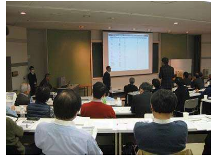
〈 部局長等合宿セッション 〉

また、毎年実施の「部局長等合宿セッション」に加え、工学部では、大学改革の取組を促進する「教員のための大学改革マインド向上研修会」を実施した。