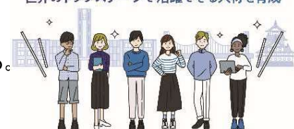
〈SGUアニメーション動画〉