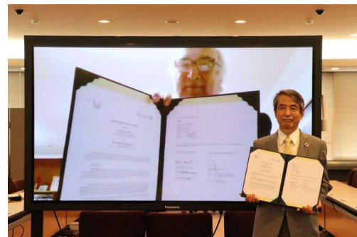
〈包括連携協定締結の様子〉

今回の協定締結をきっかけに、SDGs達成に向けて、持続可能な開発のための教育(ESD)、地球市民教育(GCED)ならびに地球憲章(Earth Charter)の3つを統合した取組を行うとともに、国際友好交流都市である岡山市とサンホセ市を交えた包括的な人材育成および社会貢献事業等を推進していく。