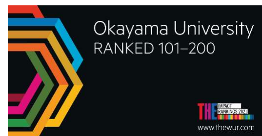
〈THE Impact Rankings 2021 logo(岡山大学)〉 https://www.timeshighereducation.com/impactrankings#1/page/0/length/25/sort_by/rank/sort_order/asc/cols/undefined

イギリスの高等教育専門誌「Times Higher Education (THE)」による「THEインパクトランキング2021」において、本学はエントリーした5つのゴール(SDG3:すべての人に健康と福祉を、SDG9:産業と技術革新の基盤をつくろう、SDG11:住み続けられるまちづくりを、SDG16:平和と公正をすべての人に、SDG17:パートナーシップで目標を達成しよう)の全てでランクインした。総合ランキングでは国内6大学と並んで、世界トップ200位以内(101-200位)、国内同列1位にランクされた。本学のSDGs大学経営の成果が評価されたものと考えており、今後もSDGs推進研究大学として、「共育・共創」でSDGsの取組みを推進していく。