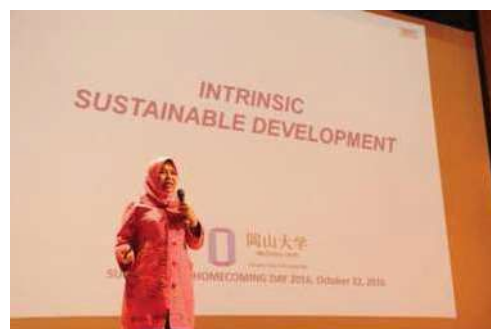
〈スーパーグローバルホームカミングデーの記念講演〉

平成28年10月に、スーパーグローバルホームカミングデーを開催し、国際同窓会の支部長を本学に招集して受入留学生増加について協力を要請するとともに、記念講演会を開催した。