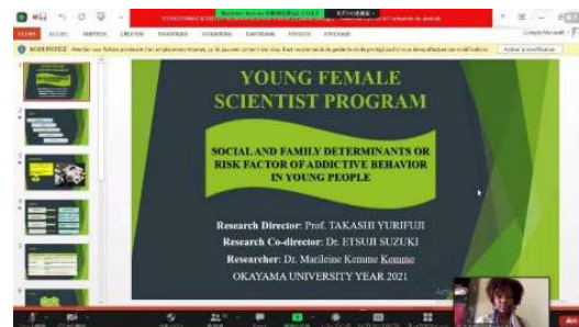
〈若手女性研究者による研究発表の様子〉

本学はこの事業を契機に、SDGs達成のための科学技術イノベーション(STI for SDGs)を実施運営する国連の中核機関であるUNCTADと連携を強化し、STI for SDGsの人材育成の取組を岡山から世界へ推進し、国内外に発信していく。