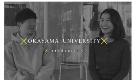
〈本学学生によるビデオメッセージ〉

本学が主催したセッションでは、人類と地球の健康を統合的に推進するための大学の果たす役割の重要性や、本学のSDGsを枠組みとする地域から世界へのグローバル・エンゲージメント戦略と取組みについて共有と意見交換を行った。