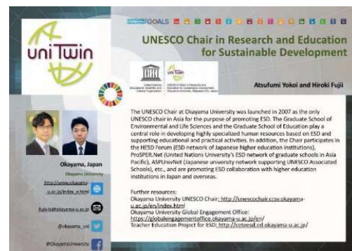
〈ユネスコ世界会議における岡山大学ユネスコチェアの紹介〉

今後、本学は岡山から国内外の様々なステークホルダーとの連携を深め、SDGs達成に向けて、ESDを一層推進していく。