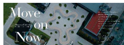
〈「スーパーグローバル大学創成支援事業」パンフレットより、「Move on Now」〉