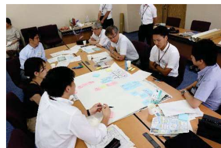
〈グループワークの様子〉

第2回の講座は、国連が提唱するSDGs(持続可能な開発目標)を題材に、岡山大学SDGs推進企画会議とコラボレーションして開催。本学の強みを知り、未来を探ることを目的に、SDGsの取り組みを事例として、同企画会議メンバーと共にグループワークを実施。本学のSDGs推進に向けた、具体的なテーマが与えられ、それぞれの課題と解決策の方向性を考えて発表した。