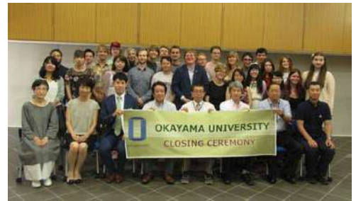
〈「地域文化研究」発表会・プログラム閉講式〉

平成30年度から新たに「ライデン大学日本語日本文化研修プログラム」を開始し、23人を受け入れた。本プログラムは、オランダ・ライデン大学人文学部との連携の下、日本語力の向上や日本文化の理解、学生交流を重視した3ヶ月の受入れプログラムである。受入留学生による「地域文化研究」発表会では、スライドを使用しながら、研修期間中に一番印象に残ったことについて発表した。本学での研修成果を母国に持ち帰り、次のステップに生かしてくれることを期待している。