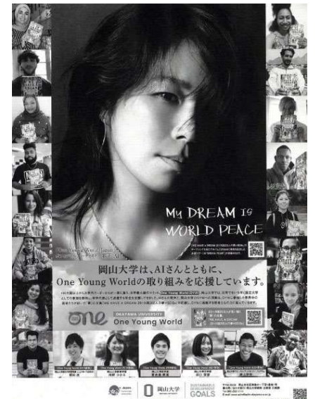
〈読売新聞に掲載した広告〉