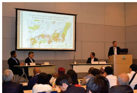
〈TICAD7公式サイドイベントシンポジウムの様子〉

2019年8月に横浜で開催された第7回アフリカ開発会議(TICAD7)の公式サイドイベントとして、「日本型開発学の可能性ーアフリカの発展と人材育成ー」をテーマにシンポジウムを実施。日本の経済、社会、企業のこれまでの成長と発展の歴史的経験について学べる修士プログラム「日本・グローバル開発学プログラム」を通じ、本学ならではのアフリカ諸国における将来のリーダー育成について議論した。加えて、本学のアフリカ諸国出身学生の受入れ実績や現地におけるネットワーク拡大に向けた取り組みをテーマにブース出展を行い、現地の政府機関や高等教育機関の関係者らとのネットワーク構築を図った。