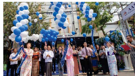
〈ミャンマー事務所開所式の様子〉

2020年3月、ミャンマー(マンダレー)に海外拠点を開設した。ベトナム(ハノイ)に続いて2か所目の拠点である。教員・修了生の強靱なネットワークを活用した現地調査を実施し、修了生が経営するビジネススクールとの業務委託契約をもって事務所を設置。この拠点を基盤に現地高等教育機関との関係強化、ダブル・ディグリー・プログラムの拡充、現地日本企業の活動支援、政府機関関係者やビジネス経営者として活躍する修了生のネットワーク強化、さらに日本留学フェアへの参加を継続し優秀な学生の獲得を目指す。