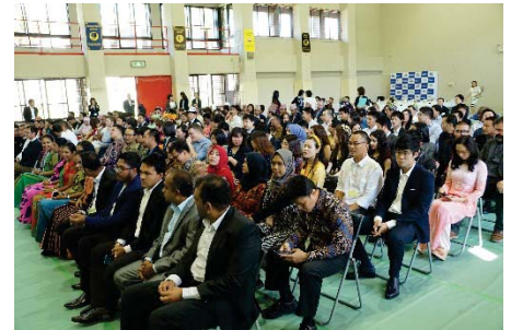
〈新入生歓迎の日の様子〉

日本語学習アプリケーション「がんばってかな」(2015年度作成)、「がんばってシャドーイング」(2016年度作成)、そして、Youtubeで配信している場面別の10の日本語学習動画教材(2015年度作成)は、毎年9月に入学する新入生に紹介することで、入学前教育としての日本語学習機会を提供している他、学外にも公開し広く提供している。日本語アプリケーションのインストール数は「がんばってかな」5,903、「がんばってシャドーイング」13,528(2020年3月現在)となっており、インストール数はこの1年間でそれぞれ、650、3,500増加し、その地域は世界100カ国・地域を超える。動画教材は全動画の総再生回数が153,000回(2020年3月現在)を超え、多くの日本語学習者に学習機会を提供している。