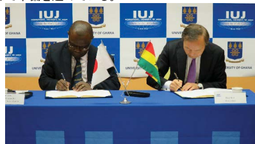
〈大学間協定締結の様子〉

「日本・アフリカ大学連携ネットワーク(JAAN)」及び留学コーディネーター配置事業の活動、現地への訪問を通して、アフリカ諸国での基盤づくりに取り組んだ。在外公館、日本企業とのネットワーク強化と同時に、現地教育機関との交流、修了生ネットワークの強化を推進することで、日本企業と現地の人材を結ぶ架け橋となる。2017年3月2日にガーナ大学とアフリカ地域に所在する高等教育機関との間では初となる大学間協定を締結した。本学は日本経済界が注目するアフリカを重点地域とし、先見性をもって人材育成に挑戦する。