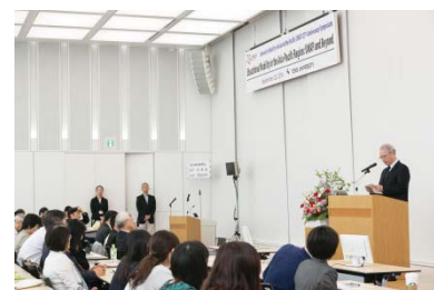
UMAP25周年記念シンポジウム 開会式の様子

UMAP (University Mobility in Asia and the Pacific)の国際事務局として、2回の国際理事会をマレーシアおよび日本で開催。また、平成28年9月23日には東洋大学白山キャンパスにおいてUMAP設立25周年記念シンポジウムを実施し、国内外の教育関係者約200名が参加した。また、平成28年度には新たに14大学がUMAPを通じた学生交換を行うための参加公約書を締結。今後も加盟校の拡大を図り、アジア太平洋地域の国際教育交流の活性化を目指していく。