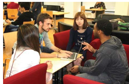
留学生との交流の様子

＜平成35年の最終目標値8.5%⇒ 現状4.8% ＞ 優秀な学生を受け入れるために、渡日前入試(タイプA 4月入学)を昨年の9月から今年は7月へと日程変更し実施した結果、出願者は123名(昨年度53名)と大幅に増え、出身国も19の国と地域(昨年8カ国)に広がった。また、海外の学事歴に対応するために、秋入学用(9月入学)の渡日前入試も開始し、17の国と地域から117名の出願があった。留学生支援コーディネーターを2名新規で配置し、外国人留学生に対して各種サポートを拡充した。