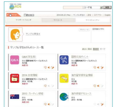
〈Eポートフォリオによる成果の可視化〉

TOYO-UCLA継続教育センター等において、全世代を対象とする共同講座を展開し、平成35年に講座開講数を500、受講者数10,000人を目指す。