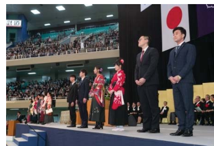
東洋グローバルリーダープログラム TGLゴールド認定式(於 卒業式)

TGLプログラムにおいて初となるTGLゴールド認定者13名が誕生し、3月の卒業式で認定証書の授与が行われた。シルバー認定者も91名(昨年度16名)に増えた。TGLキャンプへの参加者数は前年度比3.8倍の2,636名(昨年度691名)に増加し、TGLプログラムが学内に浸透してきている。