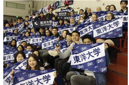
日本人学生と留学生混合での スポーツ観戦の様子

<2023の最終目標値8.0%⇒ 現状6.3% > 優秀な学生を受け入れるために、18の国と地域のリクルートフェア等に参加した。渡日前入試(タイプA 4月入学・9月入学)への志願者(240名)の出身国は26の国と地域(昨年度19の国と地域)へと広がった。従来型の正規生や交換留学生に加え、本学独自のショートプログラムや協定校向けの短期プログラムなど多様な留学生受入の仕組みを展開・拡充した。増加する留学生に対応し、日本語教育の再編、学生交流の促進、就職支援等包括的なサポートを提供している。