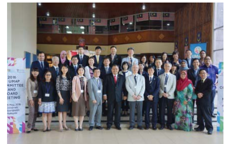
〈 UMAP国際事務局を招致 〉

UMAP国際事務局を平成28年1月より5年間本学が務めることになり、アジア太平洋地域における高等教育レベルでの交流促進に一定の貢献をすることが可能となった。さらに参加国/地域や参加大学を広げ、アジア太平洋地域における学生交流を活性化していく必要があると認識しており、これまで日本からUMAPを通じて他国に留学する学生がほとんどいなかったため、日本からの留学を促進することも視野に入れ交流スキームを見直す準備に入っている。