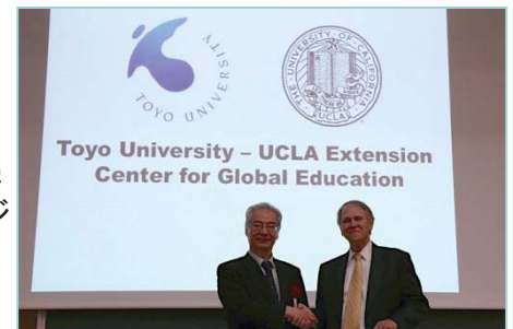
〈UCLAエクステンションとの提携〉

新学部設置や高大連携等、本学が推進する総合学園計画と連動した「全世代グローバル教育」を推進する。平成27年2月13日にUCLAエクステンションと東洋大学の間で正式協定を結び、「TOYO-UCLA継続教育センター(Toyo University - UCLA Extension Center for Global Education)」を正式に発足させた。本センターでは、BEC(Business English Communication)プログラムを提供する。また、本学学生が正規科目として受講できるコースとして、平成27年度から学部生向けの「ビジネス英語」を設置した。この授業は、UCLAエクステンションのBECと同じカリキュラムで行われ、学生が引き続きセンターでの課外クラスを受講することにより、UCLAエクステンションから認定を受けることができる。また、今後も幼稚園や小・中・高の生徒、シニアを対象にした英語プログラム、留学支援プログラム、夏期海外研修等を企画・運営し、全世代グローバル教育を実践する。