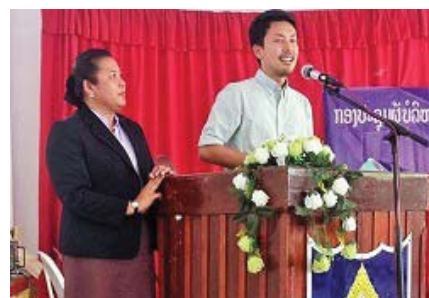
〈トビタテ！留学JAPAN第1期生が「優秀賞」「アンバサダー賞」を受賞〉

＜平成35年の最終目標値10.3%⇒現状4.3%＞ 単位認定の対象外であった海外プログラムが多数あったため、全学共通の単位認定科目群を創設したことにより、学生の海外志向上昇に繋がっている、また、国連ユースボランティア(3年続けて1名選抜)、ワシントンセンターにおけるインターンシップ(3年続けて1名が選抜)など高い競争選抜を伴う留学プログラムやインターンシップに継続して学生を派遣しており、「官民協働海外留学支援制度トビタテ！留学JAPAN」への参加学生数も増えている。