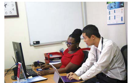
国連ユースボランティアでウガンダに派遣された学生の様子

＜平成35年の最終目標値3.1%⇒現状1.4%＞基準スコアを達成する学生が、25年度155名から28年度418名へと着実に増加した。また、課外の語学講座についても質と量の両面で拡充し、年間18講座・レベルに応じた計48コースを開講し、受講者数は1,858名(昨年の受講者は1,702名)、前年度比109.2%となった。