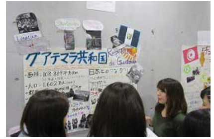
〈 TGLキャンプを実施 〉

GGJ事業のESP(English Special Program)副専攻をモデルに、本学が求めるグローバル人材に必要な能力を要件に定めた。TGLプログラムを全学的に開始した。また、第1回目のTGLキャンプを実施し、平成28年度以降は全キャンパスにおいて同キャンプを実施し、全学的に国際化を推進していく。