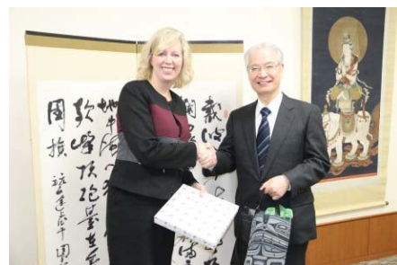
カナダ・ダグラスカレッジとの 協定調印式の様子

グローバル化に対応した教育を進めるため、海外の高等教育機関と積極的に協定を締結。新規開拓にあたっては、質の高い教育プログラムを提供する大学、また、ブリッジプログラムとして受入可能な大学を中心に協定の締結を行った。平成29年度には47大学との新規締結を行い(昨年度29大学)、昨年度に引き続き協定締結の大幅な増加となった。その結果、学生交流協定は65大学から87大学へ増加し、海外留学における本学学生の選択肢が広がった。