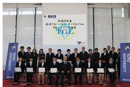
東洋グローバルリーダープログラム TGLシルバー認定式

「TOYO-UCLA継続教育センター」が提供するビジネス英語講座「BECプログラム」をはじめ、学内で実施している英会話講座「Toyo Achieve English」を学外にも開放し、ジュニア英会話講座や社会人向け英会話講座を開講。本学学生のみならず全世代へのグローバル教育を実施している。平成28年度はBECプログラムが企業研修を含め65名、Toyo Achieve English講座はジュニア講座、一般英会話講座の他、英語ガイド講座を開講し168名が受講した。