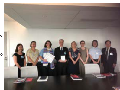
ソルボンヌ大学での調印式の様子

新規協定校の開拓にあたっては、質の高い教育プログラムを提供する大学、また、ブリッジプログラムとして受入可能な大学を中心に協定の締結を進め、今年度はフランスのソルボンヌ大学を始めとして38の大学・機関等と新規で協定を締結した。その結果、包括協定数は182協定となり、そのうち学生交換協定は87大学から114大学へと増加し、海外留学における本学学生の選択肢が広がった。AIEA等の国際会議にも積極的に参加をし、SGU事業を中心とした日本の大学の国際化に関するプレゼンテーションを本学教員が行い、本大学のプレゼンスを高めることができた。