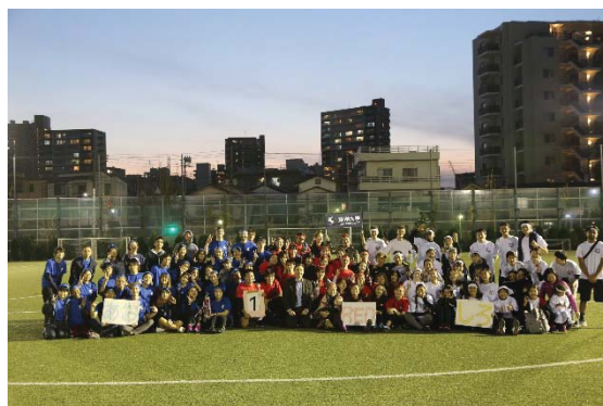
＜留学生と日本人学生の交流活動： 国際教育センター主催運動会の様子＞

＜最終目標値10.3%⇒ R元年度 5.3 %＞ 海外留学者数の増加に向けて、独自奨学金の創設、英語力強化のための正課授業と課外講座の連携、学部研修等によるプログラムの多様化、学外機関との連携による海外派遣の促進、海外拠点を利用した研修の実施等に注力している。しかしながら、新型コロナウイルス感染症の影響により、昨年度実績を下回る結果となった。