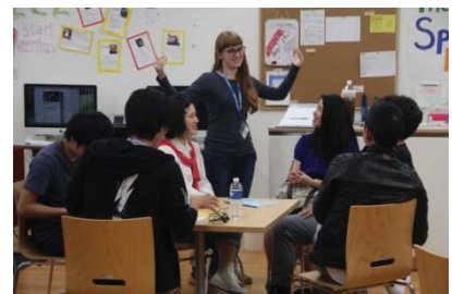
〈 English Community Zone 〉

本事業推進に伴い、各キャンパスにおいて国際化に向けた取組を実施している。各キャンパス内に国際交流スペースを設けたほか、「Toyo Achieve English」を全キャンパスで開講し、1対1・1対4のグループレッスンによる英会話能力の向上を図っている。今後はTGLキャンプの各キャンパス開催等を行っていく。