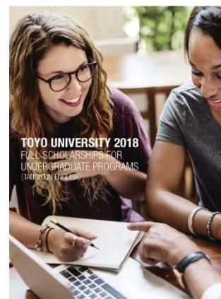
東洋トップグローバル奨学金 パンフレット

グローバル化に対応した教育を進めるため、海外の高等教育機関と積極的に協定を締結。平成28年度には37本の新規締結を行い大幅な協定本数の増加となった。うち16本は学生交換協定で、年度末時点での交換留学(学費負担型留学も含む)協定本数は66本と、平成28年度の数値目標50本を大幅に上回った。今後も世界各地で開催される国際教育分野の大会への参加や海外大学への訪問などを通じて、協定校の開拓に努めていく。