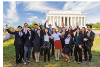
〈インターンシップ専門機関ワシントンセンター〉

今後も多様な海外研修・留学プログラムを提供して、国連ユースボランティア、ワシントンセンターなど、高い競争選抜を伴うインターンシップに継続して学生を派遣していく。海外拠点を活用した短期フィールドスタディー、東洋グローバルアライアンスと提携した主要都市におけるインターンシップ等を展開していく。