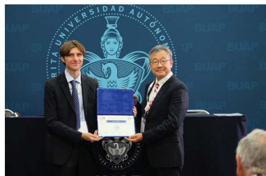
〈IAU国際総会でのISAS2.0ラーニングバッジ授与の様子〉

本学の国際化への取組は、「堅実な国際化戦略の構築がなされ、具体的な目標や指標を持ち、進捗管理により戦略・施策の調整を行っている」と高く評価され、R元年11月14日、メキシコで開催されたIAUの国際総会において、日本国内3校目のISAS2.0ラーニングバッジが授与された。