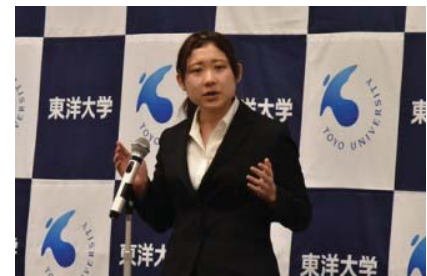
英語スピーチ&プレゼンテーションコンテストの様子 (優勝者)

<2023年の最終目標値3.6%⇒ 現状2.5% > 基準スコアを達成する学生が、786名と順調に増加している。また、TOEIC・TOEFL・IELTSの課外講座についても質と量の両面で拡充し、語学講座は、年間48講座を開講し、受講者数は2,235名(昨年度2,369名)、前年度比94%となった。英語学習の成果の発表の場として英語スピーチ&プレゼンテーションコンテストを開催した。