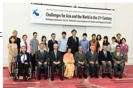
国際学部開学記念イベント「マハティール・ビン・モハマド閣下と学生の対話集会」の様子

本学のグローバル化を牽引するため、当初計画を2年前倒し、平成29年4月に国際学部グローバル・イノベーション学科(新設)及び国際地域学科(改組)を白山キャンパス内に開設した。また、国際観光学部(改組)及び情報連携学部(新設)も同時に開設した。国際学部グローバル・イノベーション学科では全ての授業を英語で実施し、日本人学生は1年間の海外留学が必須となっている。入学定員30%は外国人留学生であり、本学のグローバル化推進を加速化する役割を担っている。