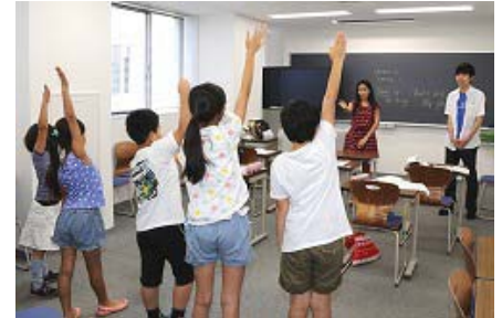
〈 Toyo Achieve English ジュニア講座 〉

「TOYO-UCLA継続教育センター」が提供するビジネス英語講座をはじめ、学内で実施している英会話講座「Toyo Achieve English」を学外にも開放し、ジュニア英会話講座や社会人向け英会話講座を提供し、本学学生のみならず全世代へのグローバル教育を実施している。