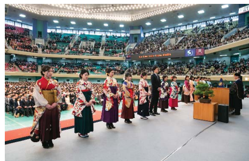
〈R元年度は新型コロナウイルスの影響により認定式を中止した。写真はR30年度認定式(於卒業式)の様子。〉

H30年度より、小学生からシニアまでの全世代グローバル教育事業の一部を、本学法人が100%出資して設立された東洋大学グローバルサービス株式会社(TUGS社)に業務委託した。TUGS社は、R元年4月から、本学河口湖セミナーハウスを活用した国内英語留学の運営を開始した。国内に居ながら英語のみの生活環境に身を置く海外留学と遜色ないプログラムは、海外留学に代わるより身近な英語学習機会として、本学学生だけでなく、中高生から社会人まで幅広く一般からの利用が見込まれている。TUGS社は、英語講座受託事業以外にも、保険代理店事業、自宅外通学者への住居案内、留学生支援を含む各種国際化関連業務の受託等、業務範囲を拡大している。今後は一層、国際教育交流プログラムの企画運営業務に携わり、教育プラットフォーム機能を担いつつ利益を還元していく計画である。