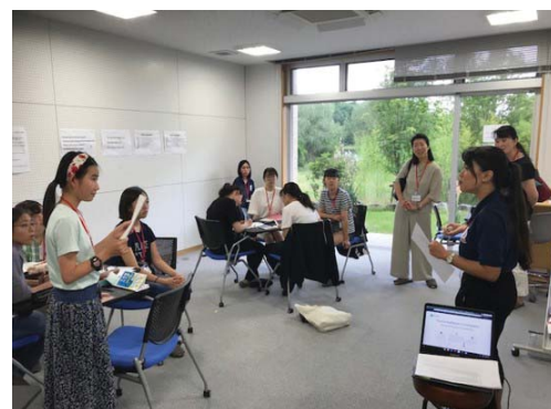
〈河口湖セミナーハウスを活用した中高生向け国内留学プログラムの様子〉