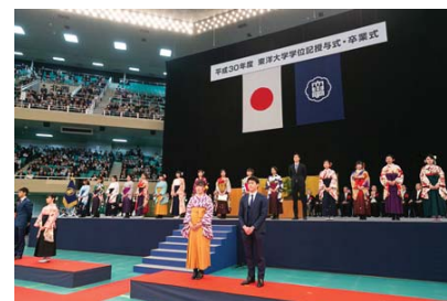
東洋グローバルリーダープログラム TGLゴールド認定式(於 卒業式)

TGLプログラムにおいて2期目となるTGLゴールド認定者26名(4年生24名・3年生2名)が誕生し、3月の卒業式で認定証書の授与が行われた。シルバー認定者も485名(昨年度91名)に増えた。今年度は、学部・学科の専門領域に応じたTGLキャンプを開催し、参加者数は前年度比1.45倍の3,828名(昨年度2,636名)に増加し、TGLプログラムが学内に浸透してきている。