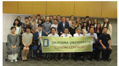
〈「地域文化研究」発表会・プログラム閉講式〉

平成30年度から新たに「ライデン大学日本語日本文化研修プログラム」を開始し、23人を受け入れた。本プログラムは、オランダ・ライデン大学人文学部との連携の下、日本語力の向上や日本文化の理解、学生交流を重視した3ヶ月の受入れプログラムである。受入留学生による「地域文化研究」発表会では、スライドを使用しながら、研修期間中に一番印象に残ったことについて発表した。本学での研修成果を母国に持ち帰り、次のステップに生かしてくれることを期待している。