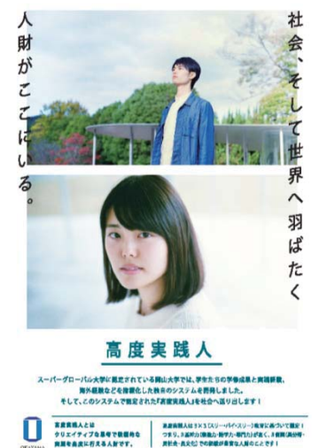
〈高度実践人パンフレット〉

平成28年度から全学60分授業、4学期(クォーター)制を導入した。また、全学教育体制を見直し、「全学教育・学生支援機構」を新設するとともに、一体化した教育改革の推進を目指し、平成29年度に向けた全学60分授業・4学期制の検証・改善と教養教育科目(リベラル・アーツ)の充実を図った。さらに、実践人を育成するPRIMEプログラムの高度実践人認定システムを構築した。