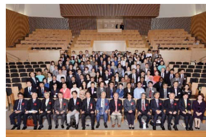
〈スーパーグローバルデーの開催〉

グローバル化・国際交流の推進を目的とした新たな試みとして「岡山大学スーパーグローバルデー2015」を開催し、国際同窓会の海外支部同窓生など国内外から集まった400人を超える来場者が交流を深めました。