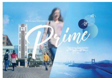
〈スーパーグローバル大学創成支援事業パンフレット(英語版)〉