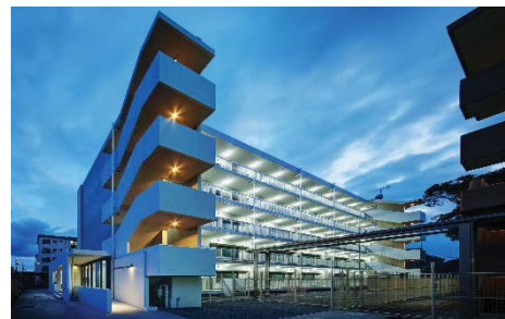
〈国際学生シェアハウス〉

教育関係組織の機能向上、簡素化を図るため、教育関係の2機構・7全学センターの改組・統合・廃止について議論を重ね、「全学教育・学生支援機構」を平成28年4月に新設することとした。このことにより、新たな業務要請(グローバル化・高大接続等)対応できるとともに、全学教育に関する議論の場を明確にした。