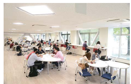
〈ラーニングコモンズ〉

中央図書館、鹿田分館の耐震改修工事により、両館にラーニングコモンズ、セミナー室・グループ学修室等の自主学修スペースを確保した。新しい施設の効果や、クリティカルシンキングやフィンランド方式対話法によるコミュニケーション能力を育成する教育プログラム開発に向けたパイロット授業等の多様なイベントを実施したことなどにより、中央図書館の平成26年度入館者数は451,894人となり、対前年度比約1.5倍に増加した。