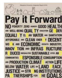
〈岡山大学統合報告書2019-Pay it Forward-(英語版)〉

発行にあたり、「岡山大学統合報告フォーラム2019」を開催し、本学同窓生・学生、高校生、他大学及び企業関係者、地域の方々ら約200人が来場した。