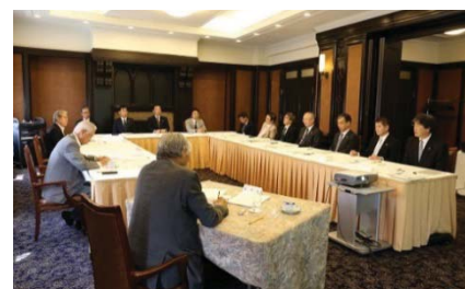
〈外部評価委員会の開催〉

外部有識者5名、本学学長、関係理事6名及び学長補佐3名による平成27年度岡山大学スーパーグローバル大学等事業外部評価委員会を開催した。構想実現に向けた数値的なプロセス管理による全学的な取組の推進と教職員への意識付けを行うことができた。