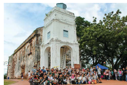
〈マレーシアにおける事務職員の海外研修〉

また、事務職員の海外研修として、マレーシア(マラヤ大学・語学研修プログラム参加)や中国へ派遣した。