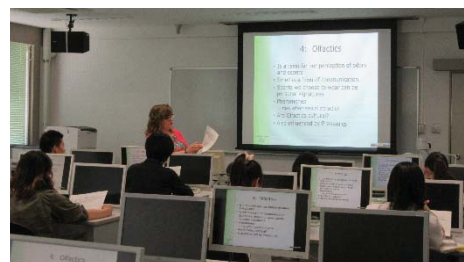
〈グローバル人材育成特別コース授業〉