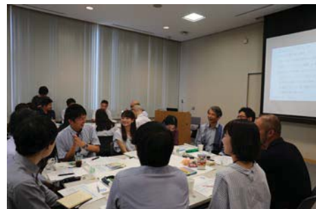
〈関連な議論が行われたグループ討議〉

本学では、次世代を担う若手教職員が自由な発想で持続可能な岡山大学を考える新たな大学ガバナンスプラットフォームとして「岡山大学未来懇談会（未来懇）」を平成29年度より開催している。令和元年度は「岡山大学×国連SDGsのさらなる深化に向けて」をテーマに、現役の若手教職員に加え岡山大学SDGsアンバサダーの本学学生も参加した。その成果として、キャンパス環境・教育・研究の目に見える改善を実行するための計画案を提案し、岡山大学が「学びたい大学」、「働きたい職場」となる「もっと選びたくなる岡山大学へ進化」のための道筋を示した。これらの提案を、今後のSDGs大学経営に反映していく。