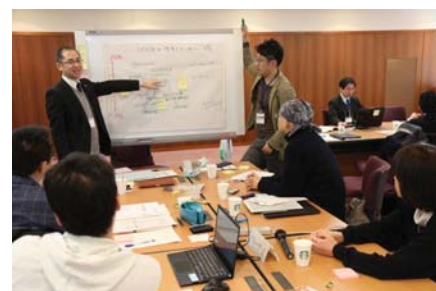
〈岡山大学未来懇談会Session1-1〉

「岡山大学の未来像～大学院の強化を中心に～」をメインテーマとし、各部局から若手教職員31名が参加して4グループに分かれ、議論では現実的な課題解決案から岡山大学の未来を拓くアイデア等を発表した。