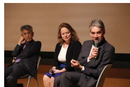
〈グローバル・ディスカバリー・プログラム開設記念シンポジウムのパネルディスカッション〉

平成29年2月に、国内外から講演者を迎え、グローバル・ディスカバリー・プログラム開設記念シンポジウムを開催した。このシンポジウムを通じ、グローバル・ディスカバリー・プログラムの更なる周知及び大規模総合大学において同様の取り組みを進めてきた米国、オランダ、日本の先進的事例を紹介し、グローバル実践人の育成に向けてのビジョンと課題について参加者間での共有を図った。