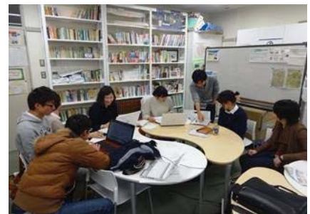
〈ヘルプスタッフによるサポート〉

オリエンテーションは、言語別(日・英)に行い、岡山大学生協、携帯電話の説明など生活に必要な情報案内を増やすとともに、寮のレジデント・アシスタント(RA)や学生ヘルプスタッフなどを通して到着直後の留学生の支援がスムーズにできるよう内容を充実させた。