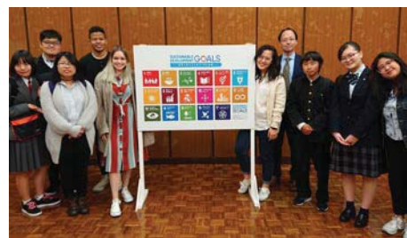
〈津山アイディアソンの報告会〉

令和2年3月現在で、142人(日本を含め25カ国)の学生がグローバル・ディスカバリー・プログラムに在籍し、総勢14人(日本を含め5カ国)の専任教員で構成する多様性に富んだ組織で運営している。授業の一環として地域社会のSDGsを考える「津山アイディアソン」に海外生を含む学生27人が参加した。津山市役所、観光協会、商工会議所関係者、NPO、地域の方々、高校生や教員等と一緒に報告会にも参加し、津山の歴史や文化を活かした体験型博物館やカフェ、環境保護活動、地域の起業家支援等について報告した。