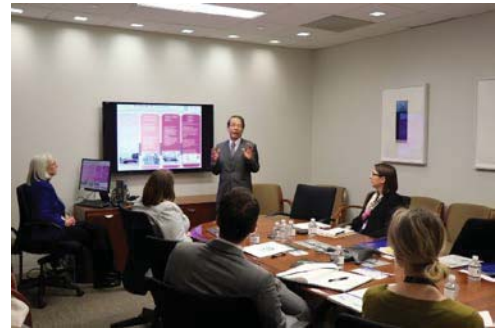
〈米国国務省・教育文化局(ECA)訪問〉

本学は、米国国務省の教育文化局(ECA)が運営する「米国国務省クリティカル・ランゲージ・スカラシップ(CLS)日本プログラム」に採択された。本プログラムは、全米の大学から集う約500人の応募者の中から学業・人物ともに優秀な大学学部生や大学院生を26人選抜し、日本の大学で日本語と日本文化を学ぶことができる2カ月間の短期留学プログラムである。2019年6月から受け入れを開始し、本学では地域を活かした課外活動やホームステイ活動等を提供して、全学レベルで進めているSDGsやESD(持続可能な開発のための教育)を通じた人材育成拠点として、グローバル教育を一層推進していく。