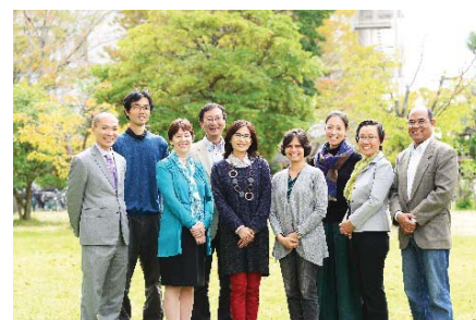
〈グローバル・ディスカバリー・プログラムの教員陣〉

入試関係では、平成28年度から実施した平成29年10月入学者の国際入試に向けて専任教員を中心に11カ国・75校の高校等を訪問した。第1期(11月～12月実施)及び第2期(2月実施)の国際入試では、15カ国から募集人員の2倍を超える53人の志願者を得た。2月に実施した国際バカロレア入試では若干名の募集に対し、4人の志願者があった。