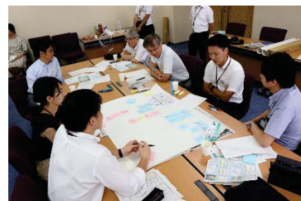
〈グループワークの様子〉

第2回の講座は、国連が提唱するSDGs(持続可能な開発目標)を題材に、岡山大学SDGs推進企画会議とコラボレーションして開催。本学の強みを知り、未来を探ることを目的に、SDGsの取り組みを事例として、同企画会議メンバーと共にグループワークを実施。本学のSDGs推進に向けた、具体的なテーマが与えられ、それぞれの課題と解決策の方向性を考えて発表した。