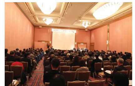
〈 産学官連携のためのシンポジウム 〉

また、実践型社会連携教育プログラムの定義(案)を定め、平成27年度に行う試行科目を決定し、平成28年度実施予定の授業科目案を作成した。今後は、プログラムの自己点検結果を踏まえ全授業科目を点検し、平成28年度に本格導入する。