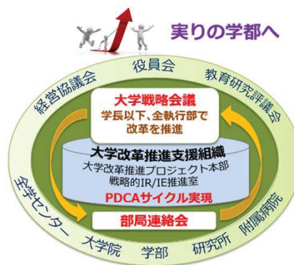
〈目標管理による推進体制〉

大学改革を包括的に推進するために、MBO-SとIR/IEによる目標管理で教職員の意識改革を図り、「大学戦略会議」、「大学改革推進のためのプロジェクト本部会議」及び「IR/IE室」を新設して、迅速な意思決定の下、大学改革の更なるスピードアップを図るとともに、IR/IE(Institutional Research/Institutional Effectiveness)によりエビデンスに基づくPDCAサイクルを確立した。