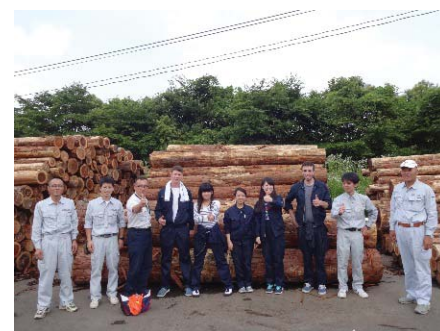
〈UBC学生とのCo-opプログラム実施〉

実践型社会連携教育科目については、試行を教養教育13科目で行い、平成28年度から教養教育約60科目及び専門教育約50科目に本格導入する。