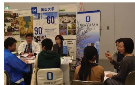
〈グローバル・ディスカバリー・プログラム広報 (第3回GO Global Japan Expo)〉

留学フェア参加や海外高校訪問を行い、広報・リクルート活動を行った。また、海外における人材需要の把握、必要とされる専門性や能力の整理を続けた。さらに学生・社会のニーズに合った教育効果の高い実践力を兼ね備えた人材を育成するカリキュラム開発及び同プログラムが求める人材に合う志願者を獲得するための入試制度を整備した。