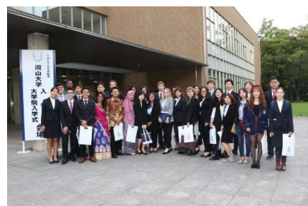
〈入学式会場前の グローバル・ディスカバリー・プログラム第1期生〉

入試関係では、第1期生の入試結果等により入試制度を見直し、3期実施していた国際入試を2期に集約した。平成30年度入学の国際入試においては、24カ国から募集人員の2.7倍を超える82人の志願者があり、国際バカロレア入試では若干人の募集に対し、7人の志願者があった。