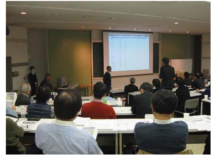
〈 部局長等合宿セッション 〉

また、毎年実施の「部局長等合宿セッション」に加え、工学部では、大学改革の取組を促進する「教員のための大学改革マインド向上研修会」を実施した。