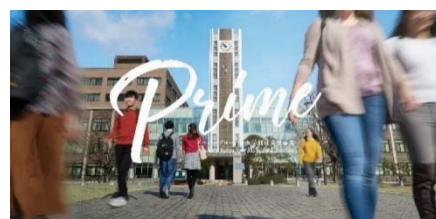
〈「スーパーグローバル大学創成支援事業」 ウェブサイトTopページ〉