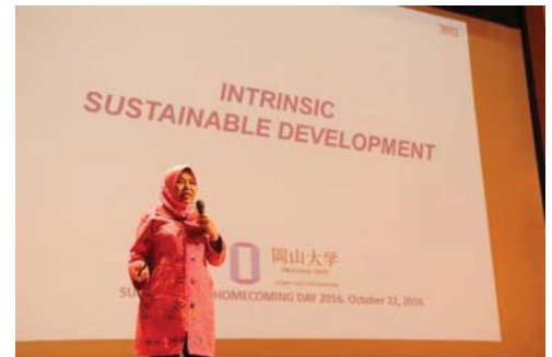
〈スーパーグローバルホームカミングデーの記念講演〉

平成28年10月に、スーパーグローバルホームカミングデーを開催し、国際同窓会の支部長を本学に招集して受入留学生増加について協力を要請するとともに、記念講演会を開催した。