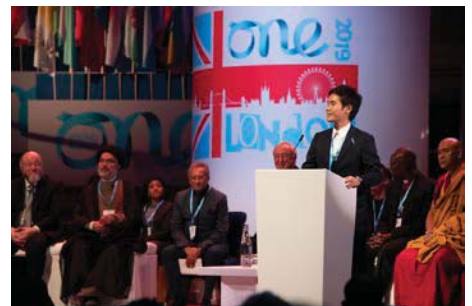
〈全体セッション登壇の様子〉

イギリス・ロンドン市で開催された「One Young World 2019」に本学の学生2人が日本代表団の一員として参加した。うち1人が、全体セッションの一つ「One Young World 宗教間対話(One Young World Interfaith Dialogue)」において世界ユース代表の1人として選出され、現職のリーダーらと共に登壇した。日本人として史上3人目となるステージ選出であり、本学として初の快挙。