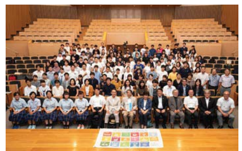
〈キックオフミーティングの開催〉

また、SDGsの普及・推進活動に賛同する個人または団体を「岡山大学SDGsアンバサダー」として任命する制度を新たに設け、133人を任命した。こうしたSDGsアンバサダーの取組が活性化することで、本学のSDGsの普及・推進が加速することが期待される。