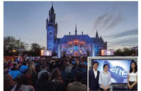
〈オランダ・ハーグでの開会式〉

オランダ・ハーグ市で開催された「One Young World (OYW) 2018」に本学の学生2人が日本代表団の一員として参加した。OYWは、世界190カ国以上から各国を代表する次世代の若いリーダーが会する世界最大級のサミットである。本学は、2015年から4大会連続で公式パートナーとして参加している。SDGsを枠組みとしながら、気候変動から戦争と平和、教育、人権、リーダーシップ、グローバルビジネス等、多岐に渡ってディスカッションを行った。