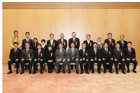
〈総理大臣官邸における授賞式〉

平成30年2月には、本学のSDGs達成の観点を取り入れた大学運営を全学的に進めるとともに、地域及び国際社会とのより一体的なパートナーシップ構築のための取組を推進することを目的として、岡山大学SDGs推進本部を設置した。