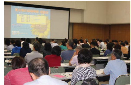
〈 留学積立金説明会の風景 〉

医学系研究科のアデレード大学・フライブルグ大学との国際共同教育研究ユニットの構築を皮切りに、全研究科において世界Top大学との連携を模索・推進し、平成29年度には5ユニット構築を目指す。