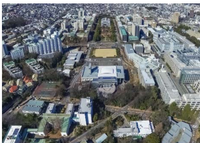
〈 東山キャンパス現況 〉

この取組が高く評価され、国土交通省、総務省、文部科学省、厚生労働省、農林水産省及び防衛省において設立された「インフラメンテナンス大賞」において、第1回文部科学大臣賞を受賞した。