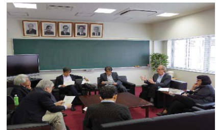
〈 本学で開催したアカデミアに関する意見交換会 〉

UBIAS(大学附属高等研究員国際連盟)は、各国の大学附属高等研究院が国際的な連携を深め、国際研究交流を促進することを目的とした組織であり、日本からは本学と早稲田大学が参加している。現在、本学はブラジルサンパウロ大学の高等研究院と共催で次世代を育成する事業「インターコンチネンタル・アカデミア」における企画・運営の中心的な役割を果たしている。平成27年4月にサンパウロ大学、平成28年3月に本学でワークショップを開催を予定している。平成26年度においては、このアカデミア実施に向けて、プログラム内容・運営方法・オンラインサイトの募集方法等について、サンパウロ大学と協議を行った。