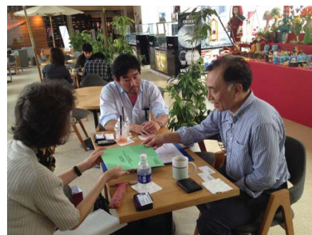
〈ベトナムにてヒアリング調査を実施〉

現在、本学では大学の計画立案、政策形成、意思決定においては、修士生サーベイや学生による授業評価アンケートを用い、データやエビデンスに基づいた業務改善を行っている。平成26年度から着手した教務システムの改修により、IRの概念を教職員が共有し、各部署等でのデータ分析を可能とし、内部質保証(PCDAサイクル)を推進する。