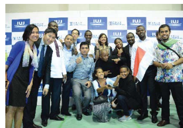
〈47ヶ国・地域から集まる留学生〉

外国語のみで学位を取得できるコースの数は、国際関係学研究科に博士後期課程を設置に伴い、採択時10コースから2014年に立ち上げた公共政策プログラムと併せ、16コースに増加し、引き続きすべての授業を英語で実施している。国際経営学研究科では、欧米のビジネススクールの収容定員に習い、収容定員を150名から180名に増員した。