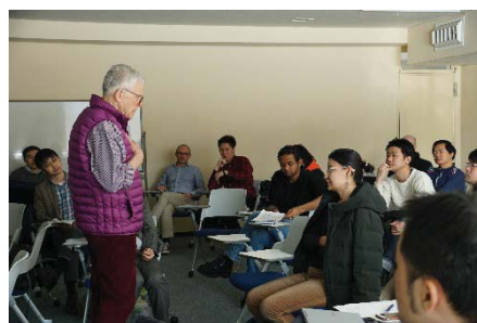
〈客員教員による講義の様子〉

また、全体の8割の教員が外国人及び外国の大学で学位を取得した専任教員である。加えて、世界のトップスクールから3名の客員教授を招聘。世界水準の教育研究環境の維持に努めている。