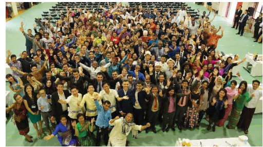
〈43ヶ国・地域から集まる留学生〉

2015年度に開設した国際大学ハanoi国家大学外国語大学ハanoi共同事務所を活用し、IUJ-ULIS Hanoi Office 1st Symposiumを主催した。本学の日本人修了生で在ベトナム日本企業(本学グローバル人材パートナーシップ企業)責任者、ハanoi工科大学教員(国際大学修了生)ならびにジェトロハanoi事務所調査員の3名をゲストスピーカーに迎え、ベトナムの産業や経済について講演を行った。本シンポジウムには、在ベトナム日本公館・機関及び日本企業関係者ならびに本学修了生など約60名が参加し、現地に展開する日本企業等との産学連携を推進した。