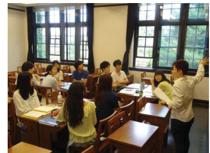
〈国際協力人材育成プログラム 講義の様子〉

「国際協力人材育成プログラム」を「国際協力人材育成プロフェッショナル・スクール」に発展させ、更に高度な学問的教育環境を提供し、アジアを題材とした「地の拠点」を確立する。学士・修士・博士の一貫教育にて、国際公務を担う人材を輩出し、グローバル・イシューの解決を促す。