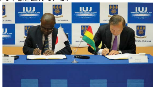
〈大学間協定締結の様子〉

「日本・アフリカ大学連携ネットワーク(JAAN)」及び留学コーディネーター配置事業の活動、現地への訪問を通して、アフリカ諸国での基盤づくりに取り組んだ。在外公館、日本企業とのネットワーク強化と同時に、現地教育機関との交流、修了生ネットワークの強化を推進することで、日本企業と現地の人材を結ぶ架け橋となる。2017年3月2日にガーナ大学とアフリカ地域に所在する高等教育機関との間では初となる大学間協定を締結した。本学は日本経済界が注目するアフリカを重点地域とし、先見性をもって人材育成に挑戦する。