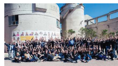
〈MBA World Summit 2018〉