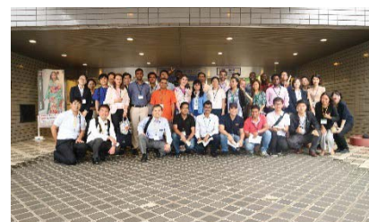
〈スタディツアーへの参加〉

また、同センター、ジェトロ新潟、国際協力機構(JICA)、日本国際協力センター(JICE)主催のアフリカビジネスセミナーに本学のアフリカ出身留学生9名が参加。アフリカ進出・展開を目指す県内企業と留学生の橋渡しをすることで、県内でのインターンシップや就職を促進するとともに、産学協働による人材育成や企業の海外展開支援につなげる。