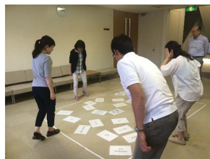
〈事務職員向けのTeam Buildingセッション〉

また、グローバル化対応研修として、本学が実施する夏期英語集中講座(IEP: Intensive English Program)への事務職員の参加を実施。実践的な英語スキルの向上とともに、異文化環境で入学予定者や企業派遣受講生と共に学ぶことによって、今後の業務や大学のサービスに応用できる能力の獲得に取り組んでいる。