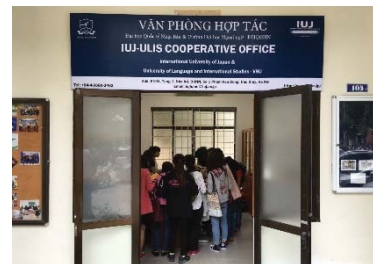
〈ハノイ国家大学外国語大学内 ハノイ事務所〉

日本経済界が次のビジネス展開の場として注視するアフリカにおいて、大学としてのプレゼンスを確立する。2020年までに拠点設立を掲げているガーナを中心に修士生及び現地日系企業の協力を得て、産学協働によるアフリカでの人材育成に貢献する。