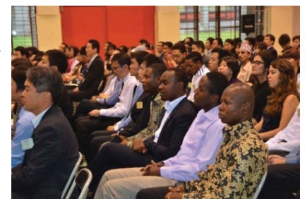
〈平成26年度入学式の様子〉

本学では、スーパーグローバル大学創成支援を通じて、グローバル化の垂直展開、水平展開を図り、社会への貢献を果たしていく。