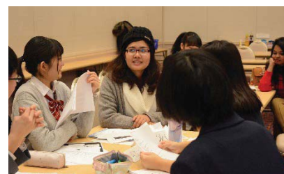
〈新潟県高校生グローバルセミナー〉

新潟県教育庁と連携して、全2回の新潟県高校生グローバルセミナーを開催。新潟県内の高校生向けに異文化理解、プレゼンテーション能力向上を図る機会を提供した。異文化コミュニケーションについての理解を深め、協働して英語で対話、議論することを通してグローバル社会において主体的に行動しようとする人材育成を目的とした。また、SGH指定校である国際情報高校や横浜市立南高等学校との交流を継続的に実施している。