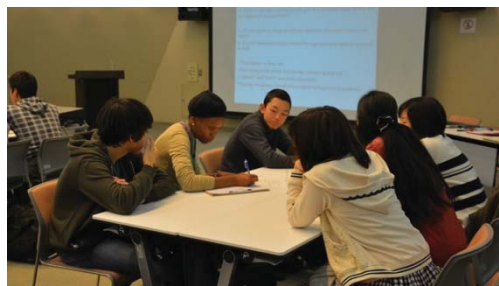
〈異文化コミュニケーション研修の結果〉

同じく南魚沼市に位置する県立国際情報高校を中心にSGH指定校との連携に努めている。国際情報高等学校は「【雪国*米どころ*魚沼】の世界発信を通じた人材育成 ~浦佐から世界へ~」を研究テーマに、地元魚沼の魅力を世界に発信しながら、地域が抱える課題、さらには関連する世界の地域課題について、グローバルな視点から考察・提案できる人材育成を目指している。取り組みの一つである地域研究の授業に本学教員及び学生が講師として参加し、プレゼンテーションの指導を実施した。また、各種行事では、本学留学生との交流の機会を提供している。加えて、今年度は横浜市立南高等学校の1年生25名を迎え、異文化コミュニケーション研修を実施した。研修は、英語を「アウトプット」することに重点を置き全編英語で実施され、本学学生もファシリテーターとして研修に参加した。本学は、積極的にSGH選定校との連携を図り、後期中等教育を支援することで、教育のグローバル化を牽引していく。