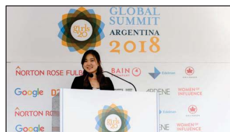
〈 Girls20サミット2018 国際女性会議に日本代表として参加[本学の参加は4年連続] 〉