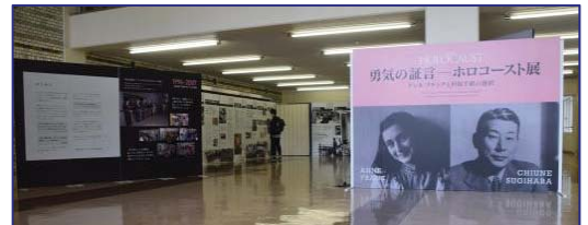
〈平和と人権を考えるホロコースト展(一般公開)を開催〉