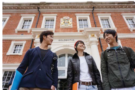
〈 ロンドン大学ゴールドスミスで学ぶ国際教養学部生 〉

平成35年度までに留学経験者数を学部生の8割、単位取得者を通年で1260名までに増加させることとしており、平成26年度の留学者数は933名となった。これには平成26年度に開設した英語のみの授業で卒業が可能な国際教養学部生78名が含まれており、1年次後期から約1年間、アメリカ、イギリス、カナダ、オーストラリアの4大学にそれぞれ20名程度に分かれて留学した。帰国後の本年後期より英語による専門科目授業などを履修していく計画となっている。