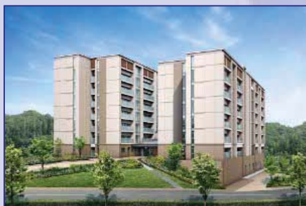
〈日本人学生と海外留学生が混住する国際学生寮 [平成29年春完成予定／男子寮イメージ]〉

海外留学生は、 五大洲47ヶ国・地域から集まり、447名(全学生の5.6%／平成28年5月現在) が学ぶ。本学では、海外留学生と日本人が共に学ぶ環境を一層充実するため、現在ある国際学生寮(収容:男子100人／女子100人)に加え、 平成29年春には男子400人、女子144人の国際学生寮が完成 する予定となる。ここでは、日本人学生と外国人留学生が混住し、異文化コミュニケーション力を養成する。