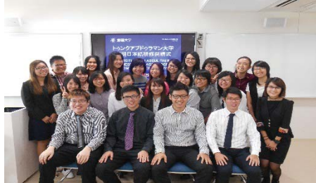
〈 マレーシアからの日本語・日本文化研修参加者 〉