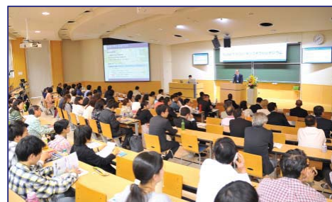
〈私立大学研究ブランディング事業のシンポジウム〉