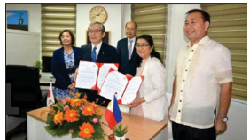
〈フィリピン事務所開所式〉