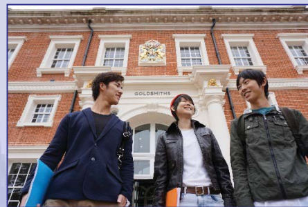
〈ロンドン大学ゴールドスミスで学ぶ国際教養学部生〉

平成26年度に開設した英語のみの授業で卒業可能な国際教養学部は、1年次後期から約1年間の留学を必修としており、学生はアメリカ、イギリス、カナダ、オーストラリアに分かれて留学した。これらを含み、 平成27年度の日本人派遣留学者数は971名(全学生の12.4%) となった。