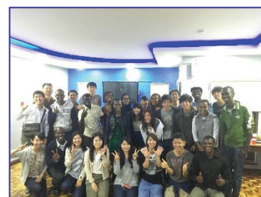
〈アフリカ諸国への留学派遣拡大〉

平成28年度には新たにケニア、インド、ミャンマーでのボランティア研修を実施し、海外インターンシップ参加者は100名(事業開始時平成26年度は13名)、海外ボランティア参加者は111名(平成26年度21名)と当該年度の目標を達成した。平成35年度は各150名の達成を目指す。