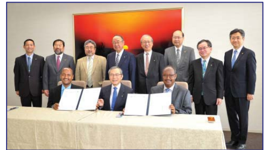
〈バハルダール大学・インジバラ大学と交流協定を締結〉