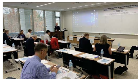
〈 G20研究会議の様相 〉

令和元年6月に大阪で開催される20カ国・地域(G20)首脳会議に向けた研究会議が、平成30年12月10日に本学で開始された。本学平和問題研究所とトロント大学G20研究グループ、グリフィス大学アジア研究所、ロシア大統領府国家経済行政アカデミーが共催し、外交官、研究者、実務家ら約30名が参加。世界経済、ジェンダー、持続可能な開発、気候変動などのテーマで分科会を開催した。