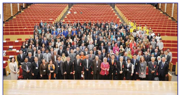
〈本学でASAIHL年次総会を日本初開催〉