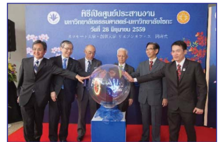
〈創価大学タイ事務所開所式典(平成28年6月)〉

平成28年6月にはタイの交流校タマサート大学内に「創価大学タイ事務所」、9月には韓国・ソウル市内に「創価大学韓国事務所」を設置。これにより、本学の海外拠点は中国・北京の「創価大学北京事務所」(平成18年度設置)と合わせて3カ所となった。