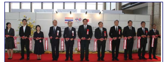
〈日タイ修好130周年記念写真展(一般公開)を開催〉