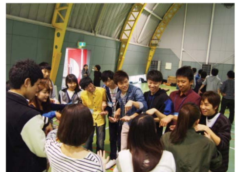
〈アクティブ・ラーニングのプロジェクト・アドベンチャー研修の様子〉

このAP事業では、これまで本学が取り組んできたアクティブ・ラーニングの質を向上させ、成果の可視化や評価を行う取り組みをとおして、アクティブ・ラーニング科目を本学の全科目数の8割で実施し、全学生がアクティブ・ラーニング科目を4科目以上履修することとなる。このアクティブ・ラーニングの本格的な全学展開により、Learning Through Discussion (LTD)やProject Based Learning (PBL)等のアクティブ・ラーニングが全学的に推進され、本学の学士課程教育の国際通用性が向上されることとなった。