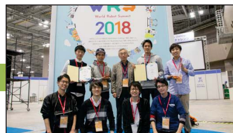
〈 World Robot Summit 2018 で世界第2位 〉