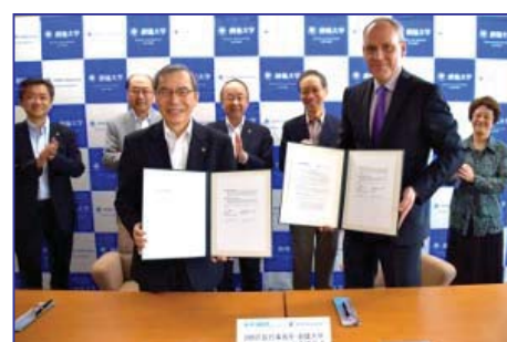
〈国連高等弁務官事務所 (UNHCR) との交流協定締結〉

平成28年6月に、ロシアのルースキ・ミール基金から各種支援を受け、日本の大学で初めてとなる「ロシアセンター」を本学校舎内にオープンした。今後、同財団及び在日ロシア大使館等との連携により、ロシア語及びロシア文化普及の役割を担う。