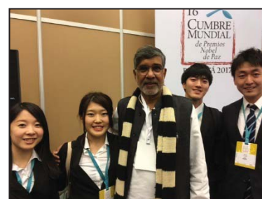
〈ノーベル平和賞受賞者の カイラシュ・サティアーアティ氏と共に〉

平成29年2月、南米コロンビアで開催された「ノーベル平和賞受賞者世界サミット」に本学学生4名が参加。参加した世界各国からの青年と「平和と持続的開発」、「平和と教育」等についてディスカッションを行い、本学学生が「青年宣言」の作成に携わり本学女子学生1名が発表者の1人として活躍した。