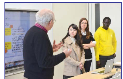
〈English Trackを11コースへと拡大予定〉

共通科目・専門科目とも英語による科目履修だけで卒業できる国際教養学部(平成26年度開設)では、専任教員17名のうち11名まで外国籍の教員を採用し、全学と学部運営に関わる会議資料をすべて英語化することで、学部教授会を完全に英語で実施している。