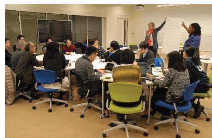
〈 短期FD研修の様子 〉

平成26年度はアメリカ・コロンビア大学ティーチャーズカレッジに教員1名を派遣(1 Semester)し、現地学生に英語による専門科目授業を実施した。また非英語圏学生への英語による授業法のスキルアップを目的として短期FD研修を開催し、2名の外国人講師をアメリカ・南カルフォルニア大学から招き、本学において17名が参加する研修を実施した。