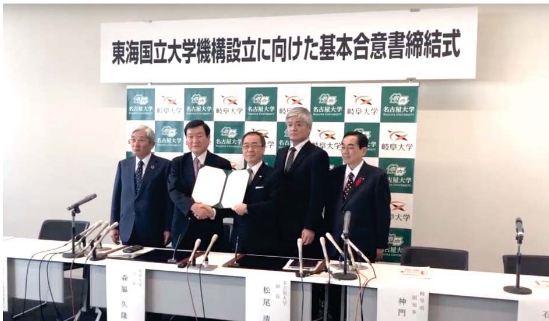
〈 基本合意書締結式の様子 〉

新法人における各大学の教育研究を中心とする機能強化及び、法人としての適切なガバナンスの確立に向け、新法人の長、学長、理事等の役員及び役員会等重要な組織に関する権限規程を、今後整理する。