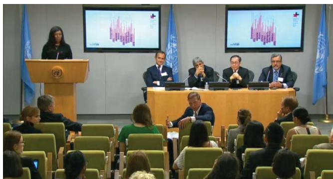
〈 HeForShe IMPACT 10×10×10 University Parity Report 記者会見の様子 〉