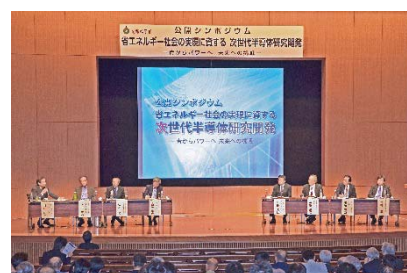
〈公開シンポジウムの様子〉

平成27年10月に発足したオールジャパン体制の「窒化ガリウム(GaN)研究コンソーシアム」を活用した取り組みとして、文部科学省の平成28年度事業「省エネルギー社会の実現に資する次世代半導体研究開発」に採択された。今後は、天野浩未来材料・システム研究所教授らが研究代表者となり、名古屋大学を中核拠点として、窒化ガリウム等を材料とした次世代半導体の早期実用化に向け、産学官が連携して研究を加速していく。