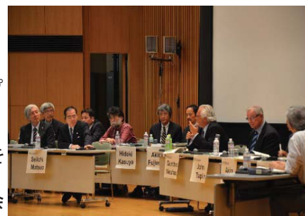
〈IABの意見に聞き入る総長・理事〉

また、外国人教員を含む国際アドバイザリーボード(IAB)4名を招へいし、本学の目標に対するアドバイスや問題点等について総長・理事と意見交換を行うパネルディスカッションも行った。予定終了時間を過ぎても、会場参加者から質問が途切れないほど盛況なシンポジウムとなった。