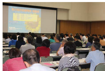
〈留学積立金説明会の風景〉

留学等を希望する学生が毎月1万円を積み立てる任意加入の制度を平成27年度から創設した。加入者の積み立てた金額が留学する時点で不足している場合、本学の貸付制度(無利子)を利用して、必要経費を用意できる。平成27年5月に学生父兄を対象とした説明会を実施し、200名を超える参加者があった。本制度は平成27年度から開始し、平成29年度には400名程度の利用を目標としている。