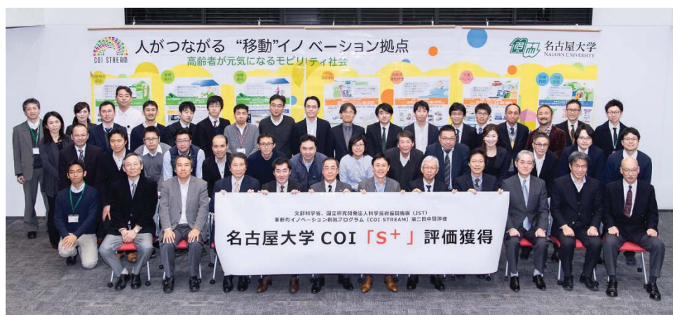
〈 名古屋大学COI 関係者 〉

文部科学省と国立研究開発法人科学技術振興機構が主導する「センター・オブ・イノベーション(COI)プログラム」の採択を受けた全国18研究拠点のうち、「人がつながる“移動”イノベーション拠点(名古屋大学COI)」は、フェーズ2終了時の本年度に実施されたCOIビジョナリーチームによる中間評価の結果、最高評価である「S+」評価を受けた。これは、WPIやSGU事業の中間評価で名古屋大学が受けたS評価に並ぶ快挙であった。