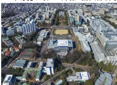
〈 東山キャンパス現況 〉

この取組が高く評価され、国土交通省、総務省、文部科学省、厚生労働省、農林水産省及び防衛省において設立された「インフラメンテナンス大賞」において、第1回文部科学大臣賞を受賞した。