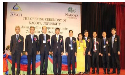
〈カンボジア国でのキャンパス開所式〉

10月よりモンゴル国・カンボジア国・ベトナム国にサテライトキャンパスを設置し、学生の受け入れを開始した。各キャンパスに現地常駐の外国人特任教員・事務補佐員を積極的に配置した。また、現地のパートナー大学との協力の下、教育・研究活動を行うための施設を整備するなど、必要な環境整備を行った。学生は、母国で現職を継続したまま本学の学生として授業を受けることが可能となり、本学の国際化(多様性)に大きく寄与している。