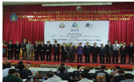
〈ラオスサテライトキャンパスの開校式の様子〉

ウズベキスタン国、フィリピン国、ラオス国に新たにサテライトキャンパスを設置した。前年度設置した3サテライトキャンパスと併せて、合計6ヶ国にサテライトキャンパスを整備している。また、平成27年度より、新たに環境学研究科が「アジア諸国の国家中枢人材養成プログラム」にプログラムの提供を開始し、合計5研究科がプログラムを提供する事となった。サテライトキャンパスの拡充及び研究科の追加によって、より多くの国を対象に、より多くの分野のプログラムの提供が可能となっている。