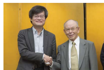
〈赤崎・天野両特別教授〉

赤崎・天野両特別教授のノーベル賞受賞を機に、省エネルギー社会の早期構築を目指し、オールジャパン体制で窒化ガリウムの成長・デバイス化・システム化に取り組むGaNコンソーシアムの平成27年度設立を主導的に進めている。準備のための意見交換会では、20以上の企業を含む40機関の参画を得ており、非常に高い関心を集めている。