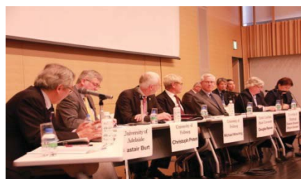
〈昨年10月に海外協定校との更なる国際共同学位プログラム促進を目的としたシンポジウム開催の様子〉

今後は、交流実績のある海外トップ大学(独国フライブルグ大学、仏国ストラスブール大学、英国エディンバラ大学、タイ国カセサート大学、米国ノースカロライナ州立大学等)との提携拡大を模索しており、積極的な活動を展開していく。