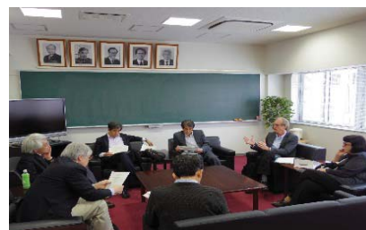
〈本学で開催したアカデミアに関する意見交換会〉

UBIAS(大学附属高等研究員国際連盟)は、各国の大学附属高等研究院が国際的な連携を深め、国際研究交流を促進することを目的とした組織であり、日本からは本学と早稲田大学が参加している。現在、本学はブラジルサンパウロ大学の高等研究院と共催で次世代を育成する事業「インターコンチネンタル・アカデミア」における企画・運営の中心的な役割を果たしている。平成27年4月にサンパウロ大学、平成28年3月に本学でワークショップを開催を予定している。平成26年度においては、このアカデミア実施に向けて、プログラム内容・運営方法・オンラインサイトの募集方法等について、サンパウロ大学と協議を行った。