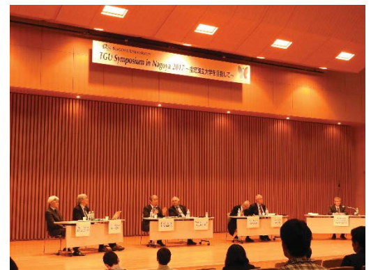
〈国際シンポジウムにおけるディスカッションの様子〉

平成29年2月17日、これまでの2年半の本事業の取組の成果を広く共有・確認するため、国内・国外の学長経験者からなる国際アドバイザリボードメンバーをお招きした国際シンポジウムを開催し、「名古屋大学が持っている高い志と、それを実現するために採用した戦略がいずれも素晴らしく、既に大きな進歩があったと理解しており、正しい道を進んでいるという印象を受けた。拍手を惜しみなく送りたい。」「ジョイント・ディグリープログラムは単なる博士学位授与にとどまらず、これを契機に海外大学との共同研究の質と量の拡充も期待でき、さらには論文の質を向上させ、教育研究資金の流入を促し、優秀な人材を惹きつけるといったサイクルを実現するだろう。」といった、多数の貴重な提言や激励がなされた。