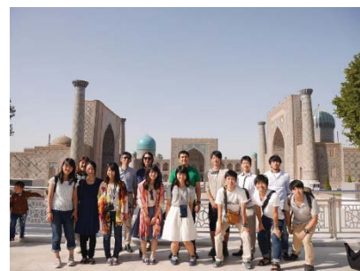
〈ウズベキスタンでの研修の様子〉

平成27年度は、海外での学習と名古屋大学内での学習を組み合わせたプログラムを教養教育科目として開講した(全学教養科目4、言語文化科目3)。全学教養科目を例にとると、プログラムを拡充するにあたり、学習内容が明確な、それぞれ独自の内容を持つ授業を設計し、運営した(米国、ウズベキスタン、タイ、英国)。学習の場のグローバルな広がりを体験する(米国)、将来的な学術研究のための基礎的姿勢を身につける(ウズベキスタン、タイ、英国)といった学習目標が達成できた。成果は、刊行物や口頭発表等で学内外に公表している。平成27年度は、101名の学生がNU-OTI科目に参加し、本学の学生派遣数は全体で1,013名にのぼった(前年度は605名)。