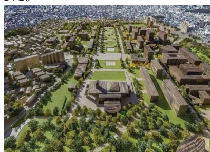
〈 30年後の東山キャンパス 〉