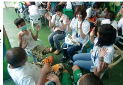
〈 立教サービスマーケティング フィリピンプログラムの様子 〉

本学では、立教グローバル・リーダーシップ・プログラム(立教GLP)、立教サービスマーケティング、海外インターンシップ及び国連ユースボランティアなど、正課・正課外において、アクティブ・ラーニングの手法を用いたプログラムを展開している。立教GLPは、どのような状況でも発揮できるリーダーシップを身につけることを目的に、GL101からGL302まで5段階の積上げ式プログラムとなっている。平成26(2014)年度から英語によるGL202がスタートし、平成27(2015)年度からは、上位科目であるGL301/302が開講することで、系統的履修プログラムが全て履修可能となる。GL301ではこれまで培ってきたリーダーシップスキルを海外の場で実践する内容を計画しており、学業奨励を目的として、海外渡航のための立教GLP奨学金制度の整備も進めている。