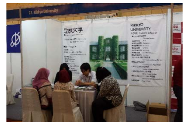
JASSOによる留学フェア

職員の高度化を目的に、所属部署に関わらず多くの職員に国際関連業務に携わる機会を提供するため、国内外で実施される留学生のための進学相談会に職員を派遣する仕組みを構築した。国際関連部署以外の職員10名が、事前に研修を受講したうえで、留学希望者に対して本学の説明や進学相談業務を行った。多様な部署の職員が留学生と関わりを持つことで、本学の国際化や留学生の受入れ体制における課題について主体的に取り組むきっかけとなることが期待できる。