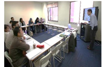
国際連携大学院プログラム

国際連携大学院プログラムの協定校の一つであるパジャジャラン大学と交流を強化している。平成29(2017)年7月と平成30(2018)年1月に、同大学から合計約80名の学生が来日し、1週間にわたり経営学及び日本文化やビジネスマナーを学ぶセミナーを開催した。また、平成29(2017)年9月には同大学の学生30名が来日し、インドネシアの民族楽器演奏と本学学生による和太鼓演奏を行い、本学学生約100名が参加する等、文化面での交流も強化した。