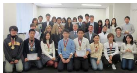
〈 第12回経営学部CLUB900表彰式 〉