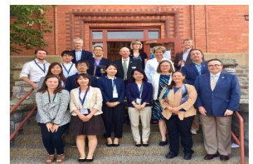
短期海外視察研修

平成30(2018)年3月に英語版大学Webサイトの全面的なリニューアルを行った。英語による情報配信量を大幅に増やし、海外広報を強化することができた。