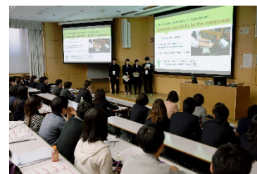
英語によるプレゼンテーション発表

当日は13校約140名の高校生が参加し、プレゼンテーション・ポスター発表(いずれも日本語または英語)を行い、本学の教員8名がプレゼンテーションの講師として参加した。本学で本発表会を開催したことで、高校教育の変革を的確に理解し、多面的な入学者選抜の実現に向けて、課題解決力や協調性、独創性といった要素をどのように評価すべきか、その知見を得る機会となった。得られた知見は、入試制度や教育内容の検討に加え、GLAPにおけるルーブリック開発にも活かすことが期待できる。また、本学教員や学生による講評や質問等の機会を通して、本学の教育や学びの一端を、高校生にも直接感じてもらう機会となった。