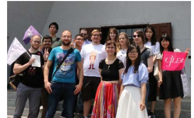
日本語短期プログラム参加者集合写真

平成28(2016)年6月、平成29(2017)年1月に日本語短期プログラムを開催し、協定校及び協定候補校から合計17名の学生を受け入れた。従来の半期または1年間の協定校からの留学生受入れに加え、短期受入れの新たなスキームを構築できた。実施にあたり、各種案内表示や学食メニューの日英併記など、プログラムを実施した新座キャンパスにおける留学生の受入れ体制の整備を進めることができた。さらに、弓道、茶道、書道等の学生団体の協力によるワークショップの開催や異文化コミュニケーション学部の学生による「通訳・翻訳者養成プログラム」との連携など、本学学生と留学生との交流機会を創出することができた。