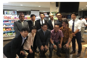
国際連携大学院プログラムの学生と教職員

インドネシア6大学との連携体制のもとに、国際連携大学院プログラムの主要スキームであるダブルディグリープログラムにおいて、平成28(2016)年9月から第1期生として3名の留学生を受け入れた。連携大学とのネットワークを活かし、短期プログラムによる学生受入れも2回行い、合計50名を受け入れた。本プログラムは、公共経営学を専門とし、英語による授業のみで修了できるコースであり、本プログラムの広報活動を行う中で、現在の連携先であるインドネシア以外の新興国においてもニーズがあることが確認できたため、平成29(2017)年度9月入学者を対象とした入試から一般入試を導入することを決定し、募集を開始した。また、ASEAN事務所の開設し、2期生のリクルーティング活動や、連携大学との調整、現地政府による奨学金や留学生派遣動向等の情報収集を効率的に行える体制を整えた。