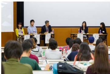
グローバルフェスタの様子

学生の留学促進を目的とし、平成27(2015)年9月に池袋キャンパスにてグローバルフェスタを開催した。留学を経験した卒業生と在学生によるパネルディスカッションや、各種海外プログラムの説明等のプログラムを実施し、延べ101名の参加があった。また、池袋及び新座キャンパスのグローバルラウンジにおいても定期的にイベントを開催しており、外国人留学生による自国文化の紹介、海外大学の学生との意見交換等、学生同士の交流の機会を提供した。グローバルラウンジイベントの参加者数は、両キャンパス併せて延べ1,951名となった。