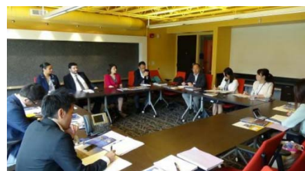
〈 ケント州立大学 Office of Global Education のスタッフとのミーティング 〉

国際的な教育・研究協力及び学生交流の拡充と高度化のための諸施策を迅速に行うため、本学の国際化推進の中核を担う組織として、平成27(2015)年4月に新たに国際化推進機構を設置した。従来からある国際センター、日本語教育センター及びグローバル教育センターを機構の中に位置づけ、相互連携の強化を目指す。さらに、国際化推進担当副総長が機構長を兼務し、大学全体の施策との連携を図る。また、各センターにかかわる事務体制についても国際化推進機構として統合し、強化を図る。なお、全学の国際化推進を審議する国際化推進会議の運営及びSGUの進捗管理・事業実施についても、国際化推進機構が統括する。