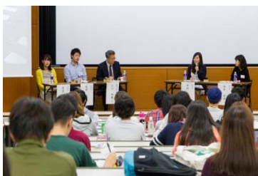
グローバルフェスタの様子

学生の留学促進を目的とし、平成27(2015)年9月に池袋キャンパスにてグローバルフェスタを開催した。留学を経験した卒業生と在学生によるパネルディスカッションや、各種海外プログラムの説明等のプログラムを実施し、延べ101名の参加があった。また、池袋及び新座キャンパスのグローバルラウンジにおいても定期的にイベントを開催しており、外国人留学生による自国文化の紹介、海外大学の学生との意見交換等、学生同士の交流の機会を提供した。グローバルラウンジイベントの参加者数は、両キャンパス併せて延べ1,951名となった。