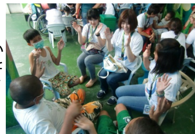
〈 立教サービスマーケティング フィリピンプログラムの様子 〉

本学では、立教グローバル・リーダーシップ・プログラム(立教GLP)、立教サービスマーケティング、海外インターンシップ及び国連ユースボランティアなど、正課・正課外において、アクティブ・ラーニングの手法を用いたプログラムを展開している。立教GLPは、どのような状況でも発揮できるリーダーシップを身につけることを目的に、GL101からGL302まで5段階の積上げ式プログラムとなっている。平成26(2014)年度から英語によるGL202がスタートし、平成27(2015)年度からは、上位科目であるGL301/302が開講することで、系統的履修プログラムが全て履修可能となる。GL301ではこれまで培ってきたリーダーシップスキルを海外の場で実践する内容を計画しており、学業奨励を目的として、海外渡航のための立教GLP奨学金制度の整備も進めている。