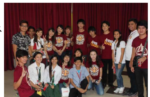
〈 経済学部グローバルコミュニケーション・インターンシップ フィリピンの様子 〉

豊島区、東京芸術劇場はじめ地元企業・商店会等と連携し、平成26年度から「池袋＝自由文化都市プロジェクト」を企画して準備を進めてきた。今後は、この取組みを足がかりに立教地域コミュニティ協議会を発足させ、地域社会の国際化を牽引していく。