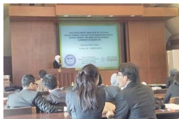
国際連携大学院プログラム協定校からの訪問の様子

人材育成による知的国際貢献として、平成28(2016)年9月から英語のみで修了できる国際連携大学院プログラムを、主にインドネシアからの外国人留学生を対象に開始する。平成27(2015)年度には、経営学研究科国際経営学専攻に新しく公共経営学コースを新設し、カリキュラム・入試制度等について具体的な準備・検討を行った。また新たにインドネシアの4つの国立大学と新規協定をMOUを締結し、本プログラムに関連してインドネシア内の合計6大学との連携体制を構築した。協定校の学生が来日した際には、本学担当者からカリキュラムの紹介等を行った。平成27(2015)年度中にすでに入試も実施し、現時点での平成28(2016)年入学予定者は3名である。