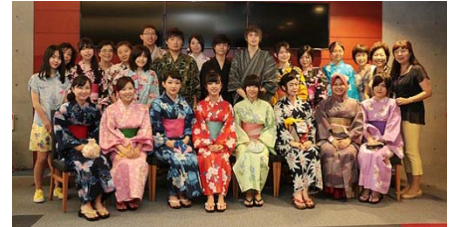
〈 ゆかたDAYの様子 〉