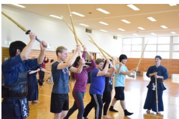
剣道体験ワークショップの様子

平成26(2014)年度から開始した職員短期海外視察を平成27(2015)年度も実施し、職員6名が参加した。学内における事前学習(学校実務英語)、国内における短期集中の国内留学プログラムを経て、英国の協定校や本学ロンドン事務所を訪問し、現地担当者と意見交換を行った。また、前年度の同研修参加者の企画・提案により、留学生向け剣道体験ワークショップが開催され、21名の留学生が参加した。本イベントは体育会剣道部学生との協力の下実施され、通常留学への参加が難しい体育会の学生にも国際交流の場を提供する機会となった。平成28(2016)年度からは、同海外視察研修参加者が海外で開催される日本留学フェア等に参加することになり、所属部署に関わらず研修後も国際関係業務に携わる機会を提供する。