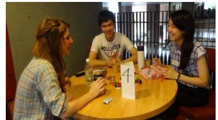
〈 World Caféの様子 〉

日本人学生がグローバルな環境に自らを置こうとする態度を端的に表すアウトカム指標を「グローバル意識指数(Global Consciousness Index, GCI)」とし、混住型学生宿舎に居住する学生の滞在時間、グローバルラウンジ訪問者の滞在時間及び海外プログラムの総参加時間を合計して年間の異文化体験総時間数を算出し、日本人学生一人あたりの年間異文化体験時間数として指標化した。平成26(2014)年度は、一人あたり平均68時間となった。また、同年度に池袋・新座の両キャンパスにグローバルラウンジを開設し、ワールドカフェ、カントリーフェスタ、異文化体験イベント等を毎月開催し、池袋では延べ620名、新座では延べ287名の参加者を集めるなど、異文化体験時間数の増加に貢献している。平成27(2015)年度も毎月多彩なプログラムを実施しており、写真展の開催や、イベント企画コンテストなど、学生参加型の取り組みを進めている。