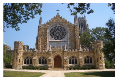
GLAP協定校の一つ サウス大学(米国)

平成29(2017)年4月のGLAP開設に向けて、平成27(2015)年度はカリキュラム、入試制度、外国人留学生との寮生活に向けた寮の整備、海外留学の必修化に向けた協定校開拓、奨学金等、諸制度の整備・検討を行った。GLAPでは本学のリベラルアーツ教育を基盤としつつ、少人数による英語でのリベラルアーツ教育、全員必修の2年次秋学期からの海外のリベラルアーツ系大学への海外留学を行い、帰国後の専門教育として「Humanities」「Citizenship」「Business」という3分野から選択し深く学んでいくプログラムである。入学者は、入学後から海外留学開始までの1年間半、外国人留学生も交え寮での共同生活を送る。平成28(2016)年度からはGLAP開設準備室を設置し、平成29(2017)年学生受入に向けて今後も準備を進めていく。