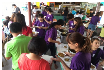
フィリピンでの海外プログラムの様子

各学部ならびに部局において新規海外派遣プログラムの開発が進み、実施時期、派遣先、目的、内容等学生のニーズにあったプログラムを提供することが可能になった。平成27(2015)年度には経済学部による英国、豪州、フィリピンで英語で経済学を学ぶプログラム(合計41名参加)、国際センターによる豪州での短期語学研修(27名参加)が開始された。また、平成27(2015)年4月から学部主催海外プログラムへの支援を目的とした教育研究コーディネーターを配置したことにより、説明会、事前オリエンテーション、帰国後の報告会等、円滑なプログラム運営が可能となった。平成27(2015)年度に本学主催の海外プログラム参加者数は、1,000名を突破し昨年度より増加した(正課・正課外含む)。