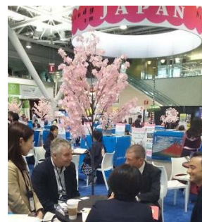
〈 NAFSA会議での様子 〉

平成26(2014)年度には、TOEIC730点、TOEFL iBT79点、IELTS6.0等と同程度の外国語力を有する学生の比率が6.1%となった。同年度には、従来から実施しているTOEICによる英語力伸長度測定テストについて受験料を無料化し、学生の継続的かつ意欲的な英語修得を支援する仕組みを構築した。12月実施分の2年次以上の受験者については、昨年度と比較して受験者数が909名から1,649名(約1.8倍)に増加した。さらに平成27(2015)年4月実施分についても、1,898名(対象者の13.9%)が受験し、着実に受験者数を伸ばしている。また、経営学部では、通算12回目となるTOEIC CLUB900の表彰が行われ、合計33名が表彰された。