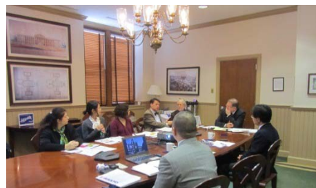
〈アメリカサウス大学との協議の様子〉

平成26(2014)年度には、ソウル、ロンドン、ニューヨークに海外拠点を設置し、現地におけるネットワーク構築に取り組んでいる。平成27(2015)年度以降は、ASEAN、中国等、開発中の教育プログラムと連動し、さらにネットワークを拡大していく計画である。