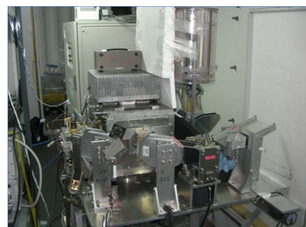
移設された超伝導ミリ波分光放射計。