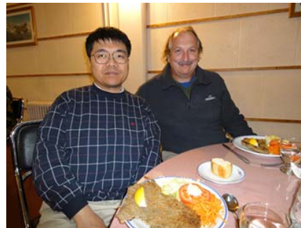
現地技術者と名古屋大学技術職員