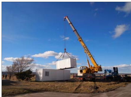
アタカマ高地より到着したコンテナ(※1)

また、現在JICAの科学技術協力プロジェクトで進められているアルゼンチンとチリのパタゴニア南部でのオゾン・紫外線の研究調査に関する国際会議に出席し、今回のミリ波観測装置の概要と共同研究の目的等について報告を行なった。また、同会議において2011年3月にオゾンゾンデ、ライダー、ミリ波を用いた同時観測を行い、測定データの相互比較を行う計画をまとめた。