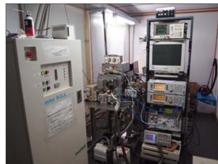
滞在期間中に立ち上げが完了した機器(※3)