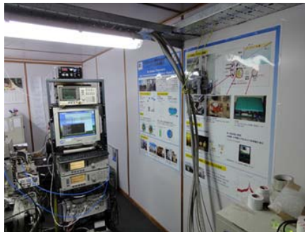
見学者の為の紹介用ポスター