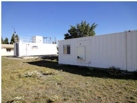
夏のリオ・ガジェゴス観測施設