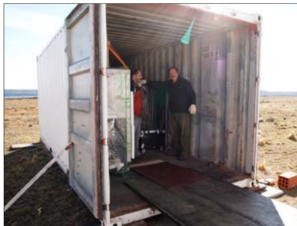
コンテナからミリ波観測装置を搬出(※2)