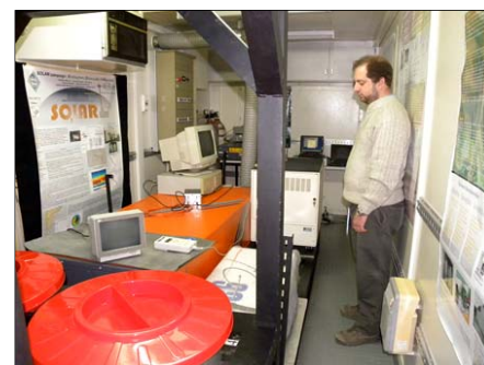
オゾンライダーコンテナの内部

現在、アルゼンチン側研究機関である CEILAP では、エアロゾル観測用ライダーの開発が行われている。今回の派遣では、まず、ブエノスアイレスにある CEILAP を訪問し、開発中のライダーの進捗状況を視察するとともに、ライダー技術の詳細や観測網構築のための考え方について助言を行った。また、森林火災や野焼きなどのバイオマス燃焼エアロゾル、火山性エアロゾル、鉱物性ダストなどのエアロゾルを捉えるための最適なネットワーク観測サイトについて、衛星データやエアロゾル輸送モデルの結果に基づいて意見交換を行った。具体的には、パタゴニアダストについて、まずリオ・ガジェゴス観測サイトにおいて昼夜連続自動観測を実現すべきことなどの提言を行った。その後、リオ・ガジェゴスの観測サイトを訪問し、オゾンライダー、紫外放射計、サンフォトメータ、ミリ波オゾン分光計などによる観測状況を視察した。また、エアロゾルライダーを設置する場合の技術的な検討を行った。