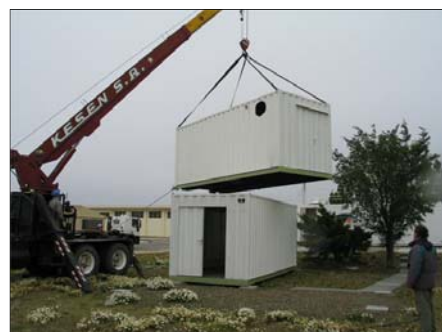
リオ・ガジェゴス観測施設内で設置作業風景。

アルゼンチン共和国のパタゴニア地区南部にはマゼラン海峡を挟んでリオ・ガジェゴス市やウシワイヤ市などの都市が存在している。南極上空の春先に発生するオゾンホールはこれらの都市の上空にも達し、住民にとってオゾンホールは南極の特殊な現象ではなく日常的な問題となっており、同地域は世界中でもっともオゾン層破壊の影響が深刻な地域となっている。また、同地域はオゾンホールの崩壊によりオゾンの減少した空気塊が中緯度帯に輸送・拡散・混合して拡がっていくプロセスを観測的に研究する上で、科学的にも重要でかつユニークな場所に位置し世界的にも注目されている。本事業では、チリ共和国アタカマ高地で稼働中の 2 台の超伝導ミリ波分光放射計のうちの 1 台をリオ・ガジェゴス市にあるアルゼンチンの レーザー応用技術研究センター(CEILAP) の観測施設に移設し、既設の差分吸収ライダー(JICA 支援の「レーザーレーダを用いたオゾン層観測強化プロジェクト」(2005-2007)で整備)と組み合わせてオゾンホールの境界部分の動態と構造を詳細に研究するための観測体制の強化を図ることを目的とする。また、そのために必要な技術移転と人材育成を行う。