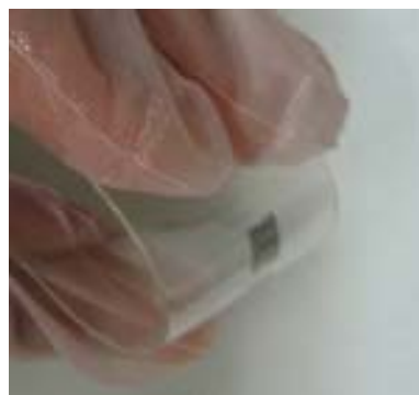
図 2. 本研究で開発した新しいシリコン薄膜転写技術により、プラスチック (PET) 基板上に形成した高品質シリコン結晶薄膜の写真。シリコン薄膜は写真のように折り曲げる事ができる。