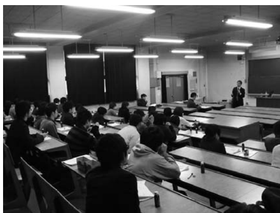
写真1. 企業研究者による「食品開発学特論」

科学・自然科学の関わり＝” キリンビバレッジ 「穀類加工品の開発の現状と課題 ー特にプレミックス、 麺・パスタ類の開発についてー」 日清フーズ 「水産天然調味料および機能性ペプチドの開発戦略」～ 「安全でおいしく健康に役立つ商品」を追求して～ 仙味 エキス 「カシス・ポリサッカライド(CAPS)の発見から商品化まで」 メルシャン 「ヘルスケア食品の開発と微生物制御」 花王 「花王における商品開発研究 ～化粧品の開発研究を 通して～」 花王