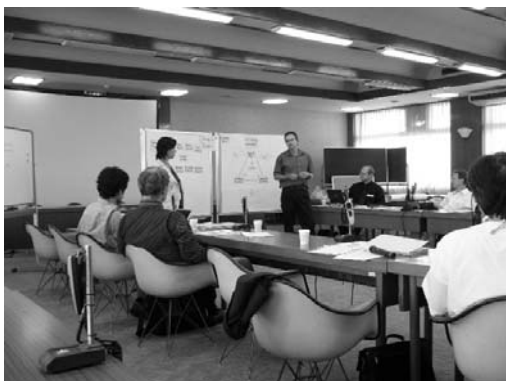
写真5. ホーエンハイム大学教員と本プログラム関連教員とのワークショップ

さらに国際シンポジウム「フードサイエンス・フードシステム国際セミナー」-食料・生命科学と国際食料需給の最先端研究-を九州大学アジア総合政策センターとの共催で開催した(平成20年3月18日, 福岡リーセントホテル)。