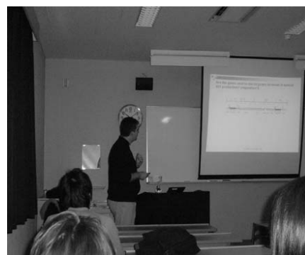
写真2. 外国人講師による「国際フードサイエンス」