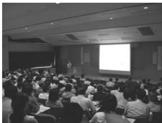
写真3. 日本食品科学工学会との共催シンポジウム