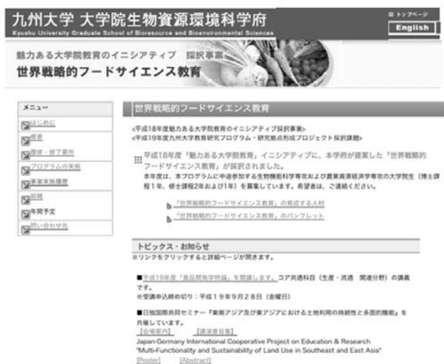
図2. 「世界戦略的フードサイエンス教育」ホームページ

講義概要や講義資料を講師の許可を得て掲載し、新規食品開発に関する基礎的および技術的情報を学内のみならず学外の関連産業界を意識して発信してきた。