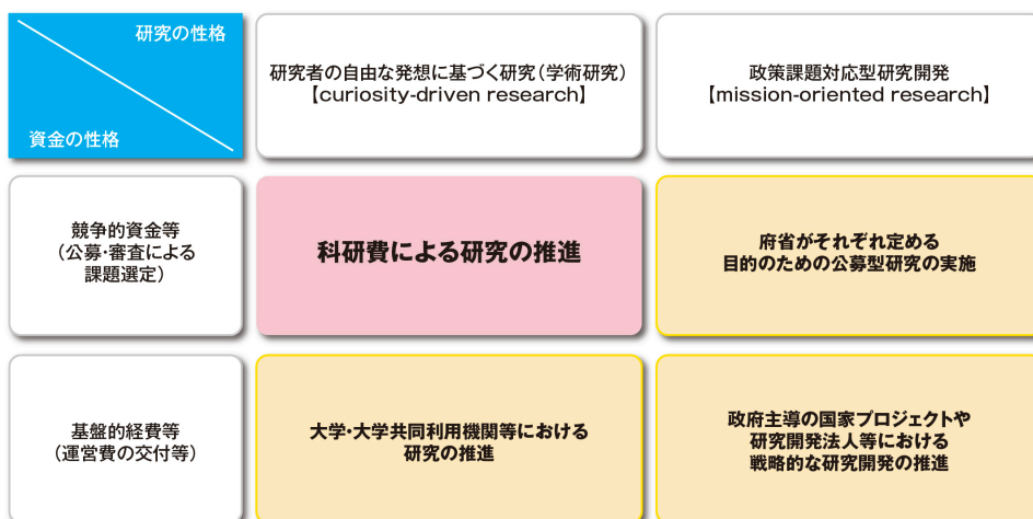
我が国の科学技術・学術振興方策における「科研費」の位置付け