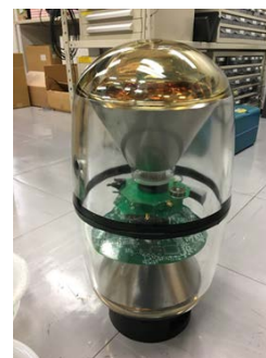
図2. 開発した D-Egg 検出器

日本グループはこのアップグレードにむけて新型検出器 D-Egg を開発しました。この検出器は実面積が従来型の7割と小型でありながら2倍の実効光検出面積を有します。この検出器を200台建造し