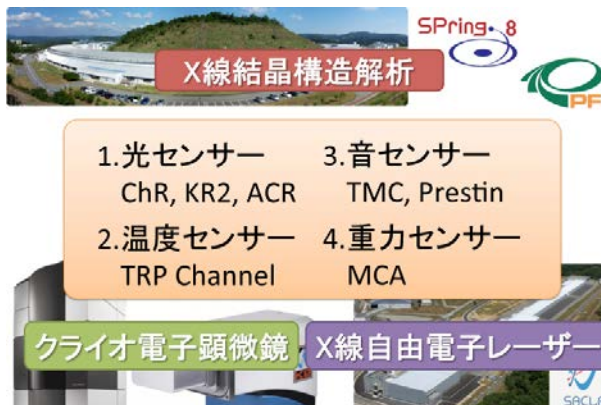
図 1. 構造解析の戦略

本研究の遂行のために、これまで以上の革新的技術を取り入れ、X線結晶構造解析、X線自由電子レーザー、クライオ電子顕微鏡単粒子解析など最先端の構造解析法を駆使し、これに MD シミュレーション、電子スピン共鳴 (ESR) 解析、1 分子 FRET、原子間力顕微鏡などのダイナミクス解析を統合して、様々な角度から構造・動態と機能の相関を明らかにする。さらに、遺伝学解析、電気生理学的解析、リポソームを用いた生化学的解析などの相補的な機能解析により、構造と機能の相関を解明して行く。