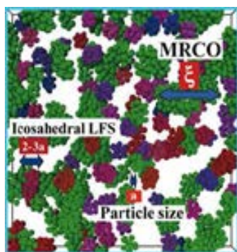
図1 剛体球液体の階層構造

本研究では、単純液体ならびにソフトマターを対象として、液体の基本的性質にかかわる以下に示す6つの未解明問題について、これらの系が共に内包する時空階層性(図1参照)に焦点を当て研究を行う: