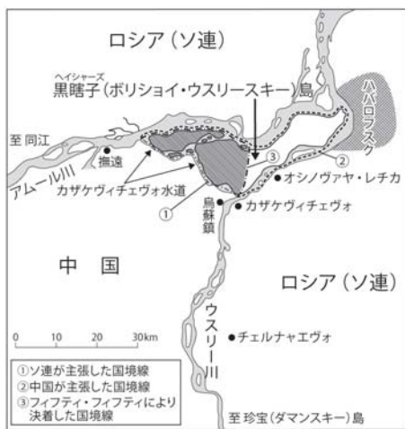
図1 係争地を「フィフティ・フィフティ」に分け合って解決