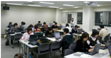
写真1 薬学教育への英語資料の導入。英語で記述された医学情報を大学専門教育へ積極的に取り入れる実践。

さらに、電子メディアで活用することのできる電子辞書やパソコンツールを開発、可能な限り無償で配布し、オンデマンド英語教材として公開。教育利用を実践。