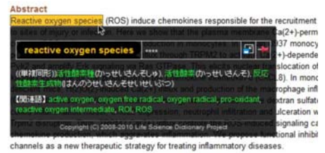
図1(左) インターネット対訳辞書WebLSDへのシソーラス機能の付与。日英の同義語、概念ツリー、共起しやすい語句による連想検索などが示され、その語句を中心にした情報検索が容易に行える。 図2(上) Firefoxマウスオーバー辞書。Webブラウザ内に表示される英語の上でショートカットキーを押しながらマウスをかざすだけで和訳が表示される機能により、英文を素速く読める。