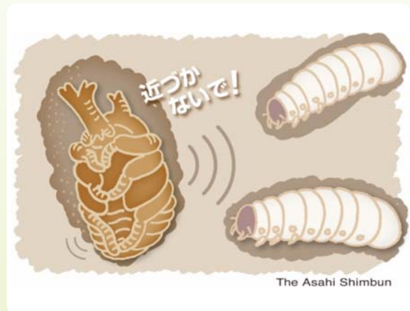
図2 カブトムシの蛹は土中で動いて振動を発生し、まわりの幼虫を近づけない

平成24-28年度 新学術領域研究(研究領域提案型)「生物規範環境応答・制御システム」(研究分担者) 研究代表者:森直樹(京都大学)