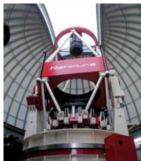
図2 ニュージーランドにあるMOA-II 1.8m望遠鏡。満月の10倍と言う広い視野を持つ。