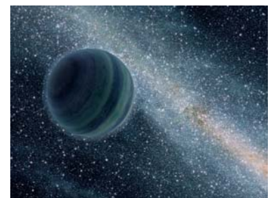
図3 浮遊惑星のイメージ図。