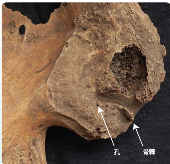
図1 縄文人骨の腸骨耳状面。骨棘や孔が認められる。加齢しつつある個体である。

平成20-22年度 若手研究(B) 「ヒトのライフヒストリーの進化史の解明: 人骨研究からの新しいアプローチ」