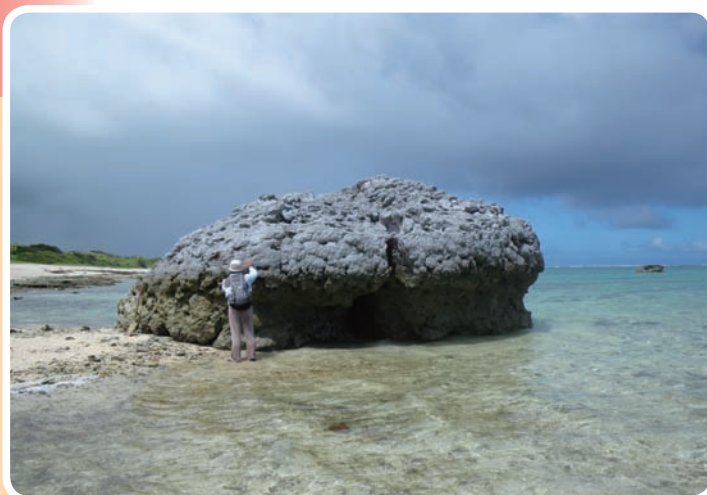
▲図1 1771年の津波で打ち上がった石垣島の「津波石」。

平成20-22年度 若手研究(B)「津波石を用いた古津波規模の地質・水理的推定方法の確立」