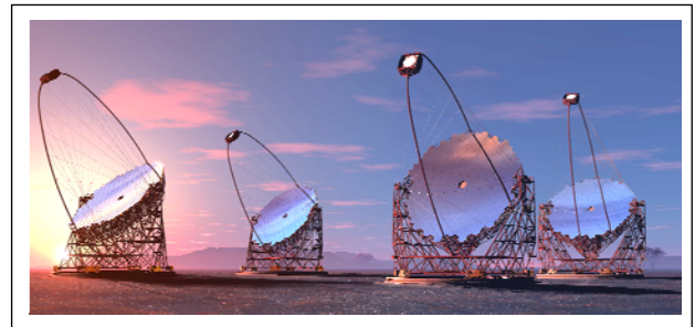
図2 CTA 大口径チェレンコフ望遠鏡完成想像図。2017年度から2019年度間に建設完了し、順次運用が開始される。

初期( z < 4 )まで及び、活動銀河核(巨大ブラックホール)、ガンマ線バースト(宇宙で一番明るい電磁波爆発)等のより多くの高エネルギー天体を広いエネルギー帯域で観測し、これら天体で起こる高エネルギー物理過程を解明する。また、今までにない最高感度で矮小楕円銀河、銀河中心に暗黒物質探索を行う。