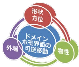
図1 形状可変材料の物性変換機能

形状可変材料とは、図1に示すように、各ドメイン量を磁場、電場、応力場などの外場で可逆的に制御、あるいはその逆にチューニングできる材料であり、形状記憶合金、磁性形状記憶合金、圧電材料が挙げられる。これらの材料の特性の向上には、外場に有利なドメインの素早い成長・発達が必要であり、これにはドメイン間に形成されるホモ界面が、外場にスムーズに反応する必要がある。この機構をドメインホモ界面のダイナミクスと呼び、本研究では形状可変材料のドメインホモ界面ダイナミクスの学理の追究を主目的とする。次に、使用寿命を決める主要原因となる界面移動に伴う摩擦について、我々が見いだした界面のねじれという視点から、このドメインホモ界面ダイナミクスについて、実験、理論、計算を行い、界面易動度が、相安定性と格子軟化挙動に依存することを実験的および計算的に解明し、革新的形状可変材料の開発のための指導原理の確立と実際の開発まで行うことを目的とする。