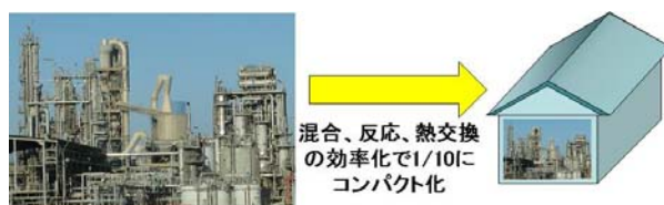
図2 大量生産型マイクロ化学プラント

本研究では、数千流路という単純な並列化では達成できない集積度のプラント構築・運転法を開発しようとしている。本開発が進めば、混合、反応、熱交換の効率化で1/10にコンパクト化された本質安全なプロセスを提供可能となり(図2参照)、我が国の化学産業の構造改革へ大きく貢献できる。